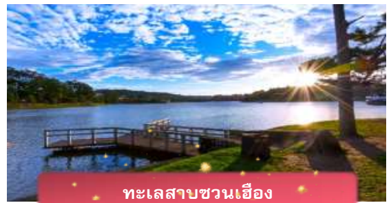
ทะเลสาบชวนเอื้อง

ที่พัก The Western Hill ระดับ 4 ดาวหรือเทียบเท่า