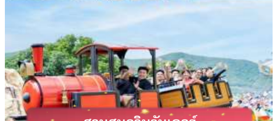
สวนสนุกวินวันเดอร์