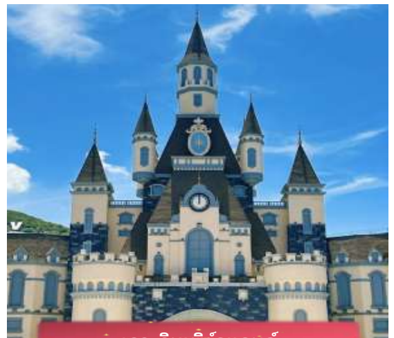
เกาะวินเพิร์ลแลนด์

เที่ยง บริการอาหารกลางวัน ณ ภัตตาคาร พิเศษ ... เมนูบุฟเฟ่ต์บนเกาะ