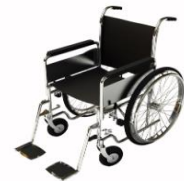
การบริการดูแลเป็นพิเศษ

กรณีผู้เดินทางต้องการความช่วยเหลือเป็นพิเศษ อาทิเช่น การใช้วีลแชร์ กรุณาแจ้งบริษัทฯ อย่างน้อย 7 วันก่อนการเดินทาง มิฉะนั้นบริษัทฯ จะไม่สามารถจัดการล่วงหน้าได้ เนื่องจากการขอใช้วีลแชร์ในสนาม บินนั้น ต้องมีขั้นตอนในการขอล่วงหน้า และบางสายการบินอาจมีการเรียกเก็บค่าใช้จ่ายทั้งทางสนามบิน ในไทยและในต่างประเทศ ซึ่งผู้เดินทางสามารถสอบถามกับเจ้าหน้าที่ได้โดยตรงก่อนทำการจอง และหาก ในขณะของท่านมีผู้ต้องการดูแลพิเศษ เช่น ผู้ที่นั่งรถเข็น (Wheelchair), เด็ก, ผู้สูงอายุและผู้ที่มีโรค ประจำตัวหรือไม่สะดวกในการเดินทางท่องเที่ยวในระยะเวลาเกินกว่า 4 - 5 ชั่วโมงติดต่อกัน ท่านและ ครอบครัวต้องให้การดูแลสมาชิกภายในครอบครัวของตนเอง เนื่องจากการเดินทางเป็นหมู่คณะ หัวหน้า ทัวร์มีความจำเป็นต้องดูแลคณะทัวร์ทั้งหมด