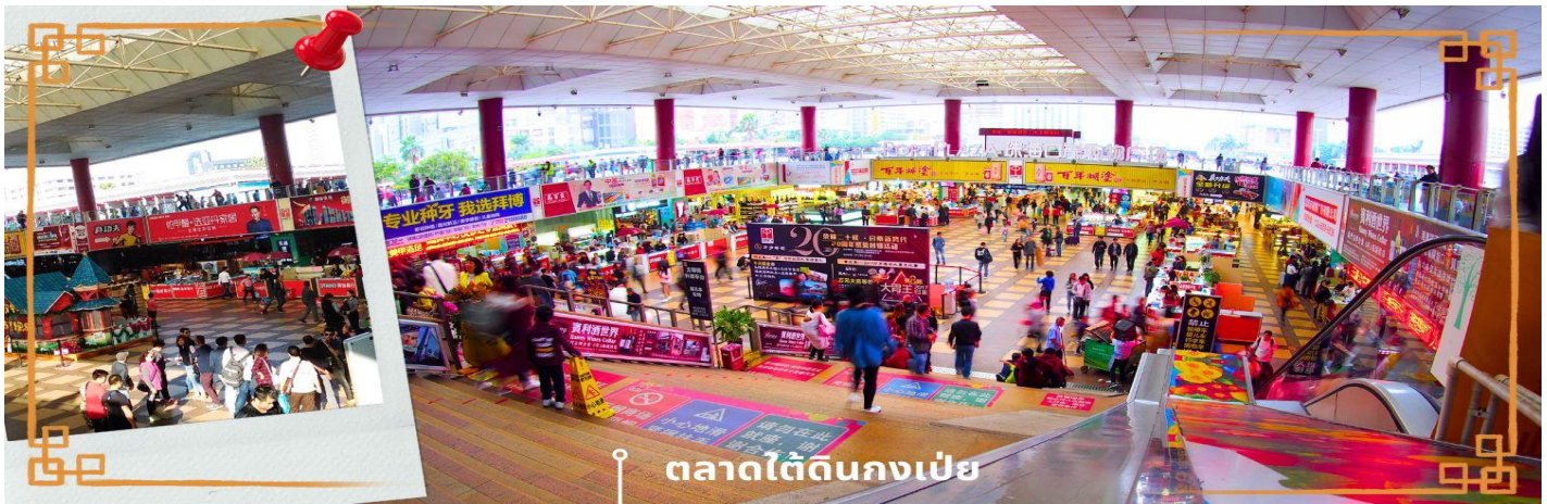
ตลาดใต้ดินกงเป๋ย

เย็น 📍 บริการอาหารเย็น ณ ภัตตาคาร (4) โรงแรมที่พัก นำท่านเข้าสู่ที่พัก IRVINE HOLIDAY HOTEL หรือเทียบเท่า