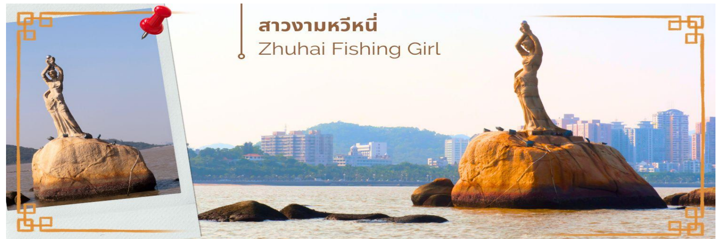
สาวงามหวิหนี่ Zhuhai Fishing Girl

จากนั้นนำท่านแวะซื้อ ยาแก่น้ำร้อนลวก ร้านยา เป่าฟู่หลิง บัวหิมะ ยาประจำบ้านที่มีชื่อเสียง ท่านจะได้ชมการสาธิตการนวดเท้า ซึ่งเป็นอีกวิธีหนึ่งในการผ่อนคลายความเครียด และบำรุงการไหลเวียนของโลหิตด้วยวิถีธรรมชาติ และนำท่าน