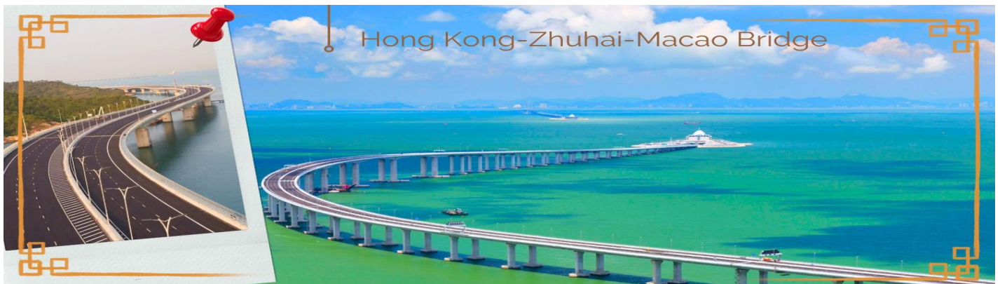
CHXH10 ฮองกง-มาเก๊า-จูไห่ 4 วัน 2 คืน บิน Hong Kong Airlines (HX) May-Oct'26

02.40 น. นำท่านเดินทางสู่ ฮองกง โดยสายการบิน HONG KONG AIRLINES (HX) เที่ยวบินที่ HX768 07.00 น. เดินทางถึงสนามบินเช็กแล็บก๊อก เขตปกครองพิเศษฮองกง นำทุกท่านเข้าพิธีการตรวจคนเข้าเมืองหลังจากผ่านพิธีการตรวจคนเข้าเมืองเป็นที่เรียบร้อยแล้ว รับกระเป๋าสัมภาระ และเดินทางโดยรถโค้ชปรับอากาศ เวลาท้องถิ่นที่ฮองกงเร็วกว่าประเทศไทย 1 ชั่วโมง กรุณาปรับนาฬิกาให้ตรงกับเวลาท้องถิ่น เพื่อสะดวกในการนัดเวลา จากนั้นนำท่านเดินทางสู่ มาเก๊า (MACAU) หรือ เอ้าเหมิน (รถโค้ชปรับอากาศ) ด้วยการเดินทางผ่านเส้นทางสะพาน Hong kong – Zhuhai – Macao Bridge สะพานมีความยาว 55 กิโลเมตร ซึ่งเป็นสะพานข้ามทะเลที่ยาวที่สุดในโลก สะพานดังกล่าวเปิดใช้งาน เมื่อวันที่ 23 ต.ค. 2561 ซึ่งเชื่อมระหว่างเขตบริหารพิเศษฮองกง กับเมืองจูไห่ของมณฑลกวางตุ้ง และเขตบริหารพิเศษมาเก๊าของจีน โดยสะพานเส้นทางนี้นับเป็นครั้งแรก ที่จะช่วยลดระยะเวลาการเดินทางจากฮองกง ไปยังจูไห่และมาเก๊า จากเดิม 3 ชั่วโมง ให้เหลือเพียงภายใน 1 ชั่วโมง มาเก๊า มีชื่อทางการว่า เขตบริหารพิเศษมาเก๊าแห่งสาธารณรัฐประชาชนจีน เป็นพื้นที่บนชายฝั่งทางใต้ของประเทศจีน เป็นเขตปกครองพิเศษของจีน โดยมีฐานะเป็น เขตบริหารพิเศษภายใต้หลักการ หนึ่งประเทศสองระบบ ผู้ที่อาศัยอยู่ในมาเก๊าส่วนใหญ่พูดภาษากวางตุ้งเป็นภาษาแม่ ภาษาจีนกลาง ภาษาโปรตุเกส และภาษาอังกฤษ ชาวมาเก๊า มีความหมายโดยกว้างๆ คือผู้ที่พำนักอาศัยถาวรอยู่ในมาเก๊า ส่วนในวงแคบ หมายถึง คนพื้นเมืองในมาเก๊าที่สืบทอดมาจากชาวโปรตุเกส มักจะผสมกับชาวจีนและบรรพบุรุษชาติอื่นๆ