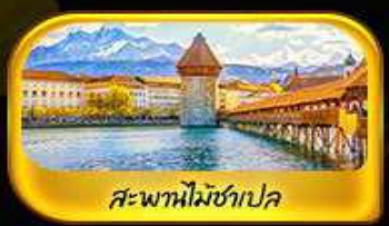
สะพานไมซ์าเปลา