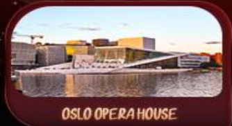
OSLO OPERA HOUSE

รหัสโปรแกรม : SEK156 95 วัน 6 คืน เช่าตั๋วเครื่องบิน-ออกโคเปนเฮเกน