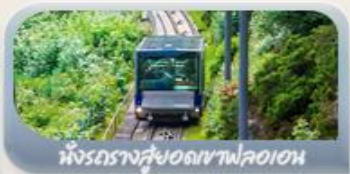
นั่งรถรางสู่ยอดเขาฟลอมอน