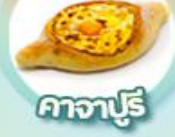
คัจจาปูรี