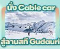
นั่ง Cable car สู่ลานสกี Gudauri