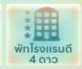
พักโรงแรมดี 4 ดาว