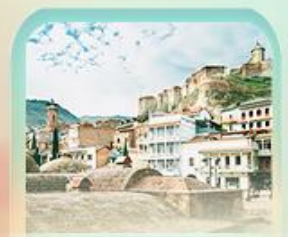
อะบาโทตูปานี