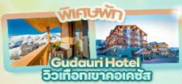
ที่พัก Gudauri Hotel วิวเทือกเขาคอเคซัส

Tbilisi Gudauri Borjomi Kazbegi Uplistsikhe