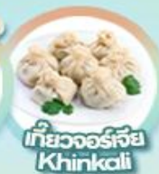
เกี้ยวจอร์เจีย Khinkali