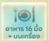
อาหาร 16 มื้อ + บนเครื่อง

เดินทาง 10-17 ก.ย.69 / 24 ก.ย.-01 ต.ค. 69