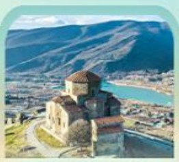
มทสวิตซารวารี