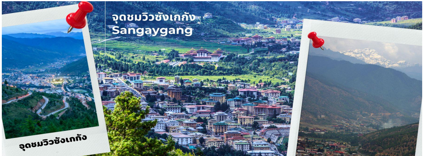
จุดชมวิวยังเกกัง

ค่ำ รับประทานอาหารค่ำ ณ ภัตตาคาร (มื้อที่ 8) นำทุกท่านเข้าสู่ที่พัก โรงแรม Metta Resort เมืองพาโร ระดับ 3 ดาว หรือเทียบเท่า