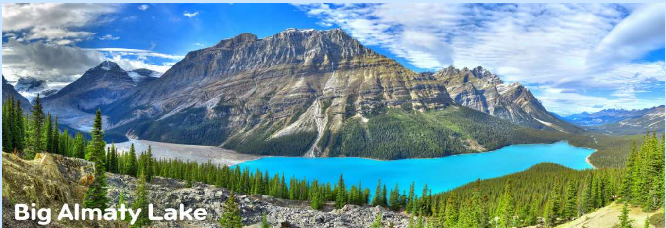
Big Almaty Lake

เช้า รับประทานอาหารเช้า ณ ห้องอาหารโรงแรม