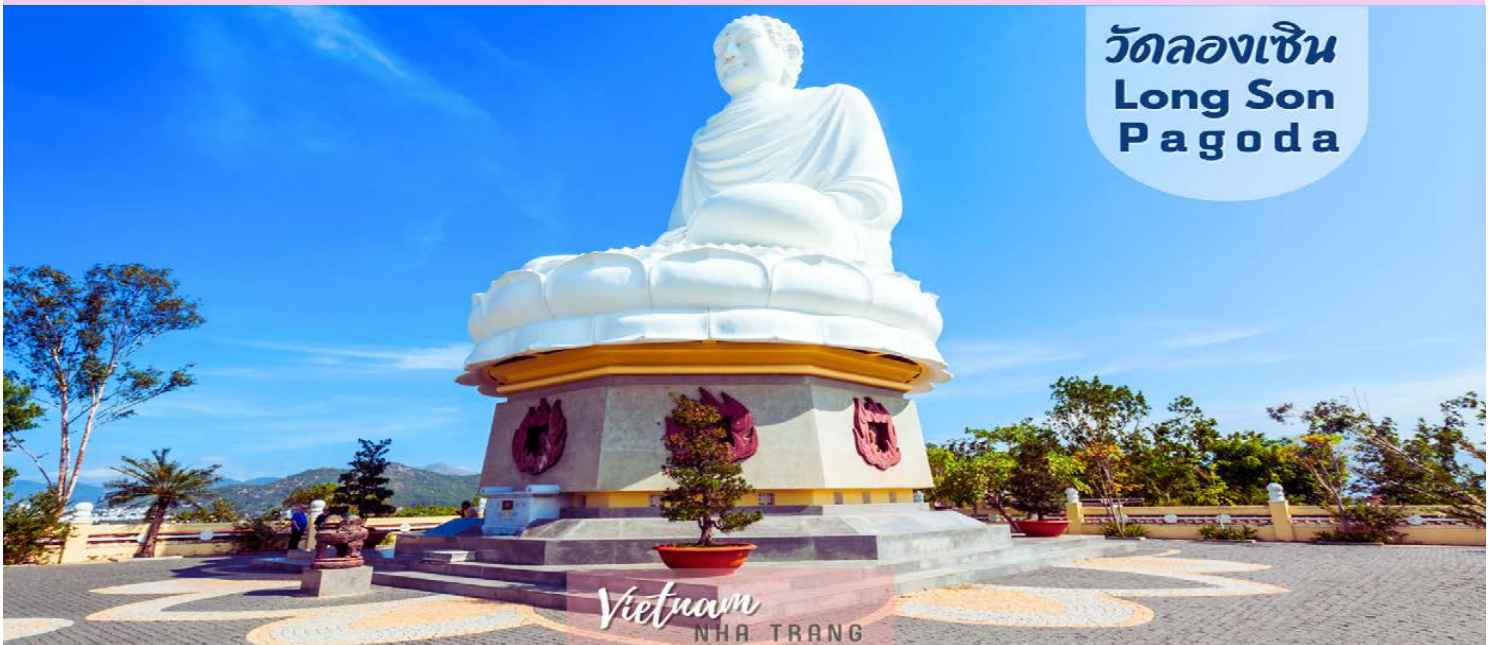
วัดลองเซิน Long Son Pagoda

นำท่านไหว้พระที่ วัด LONG SON เป็นวัดที่สร้างขึ้นในปีพ.ศ. 2429 จุดเด่นของวัดนี้คือ พระพุทธรูปสีขาวองค์ใหญ่ สูง 14 เมตร ตั้งอยู่บนเนินเขาที่ต้องเดินขึ้นบันได 152 ขั้น ระหว่างทางจะมีพระนอนที่แกะสลักจากหินอ่อนและด้านบนสามารถชมวิวเมืองญาจางได้อีกด้วย