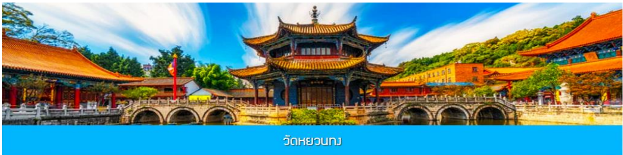
วัดหยวนกง

พักที่ VIENNA HOTEL ระดับ 4 ดาว หรือเทียบเท่าในเมืองคุนหมิง