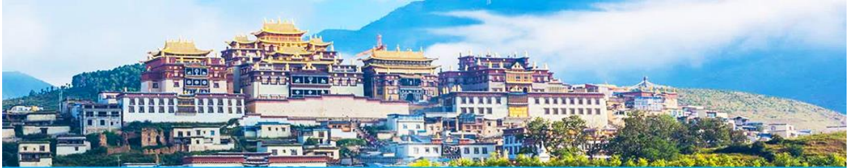
เมืองโบราณแขวงกริลา

จากนั้นนำท่านชม หมู่บ้านธิโจวหรือหมู่บ้านชาไป๋ ชมพื้นที่เมืองที่สำคัญของเมือง ชมการแสดงของชนชาติปายพร้อมชิมชาสามแก้ว เพื่อรำลึกถึงวิถีชีวิตและการเกิดมาเป็นมนุษย์ของตนเอง ซึ่งถือเป็นเอกลักษณ์ของชนชาไป๋ที่หาดูได้ยาก