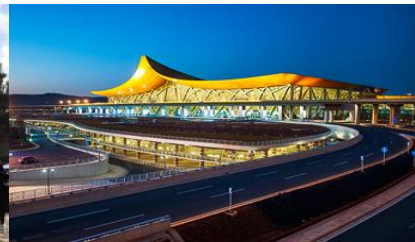
สนามบินเมืองคุนหมิง