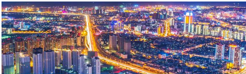
นครคุนหมิง