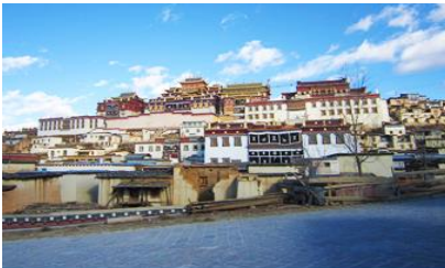
วัดลามาเซงจ้านหลิง