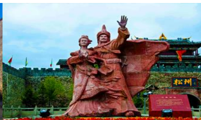
เมืองโบราณขงพาน