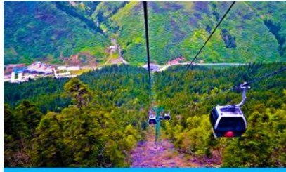
นั่งกระเช้าขึ้นสู่อุทยานหวงหลง