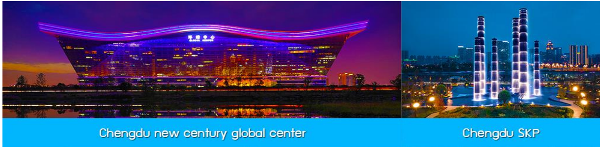
Chengdu new century global center