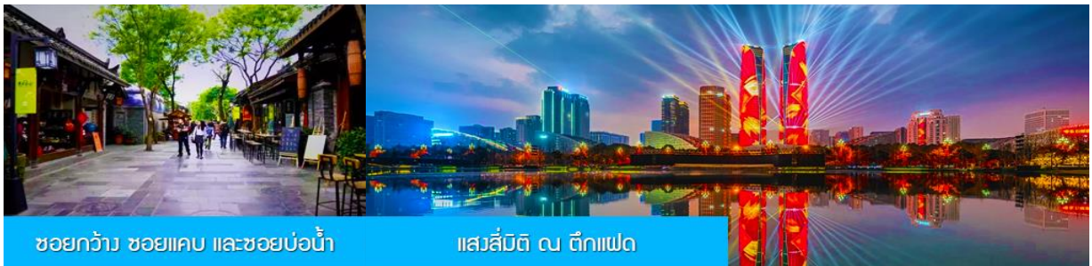
ซอยกว้าง ซอยแคบ และซอยบ่อน้ำ

หลังอาหารนำท่านเที่ยวชม ย่านธุรกิจใจกลางเมืองเฉิงตู ที่ประกอบด้วยห้างสรรพสินค้าชั้นนำ ได้แก่ ห้าง SKP และ Chengdu New Global Center ที่เป็นโครงการเอนกประสงค์ที่มีทั้งโรงแรมหรู ห้างสรรพสินค้า สวนสนุก ในร่ม อาคารสำนักงาน และน้ำพุดนตรีกลางแจ้ง.....ให้ท่านมีเวลาเพลิดเพลินกับการเที่ยวชม ถ่ายภาพ เช็คอิน และช้อปปิ้งในย่านการค้าใจกลางเมืองอย่างเต็มที่.....จนครบแก่เวลานำท่านสู่ภัตตาคาร