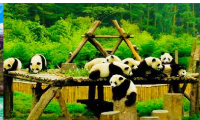
สวนหมีแพนด้าตูเจียวเยี่ยน