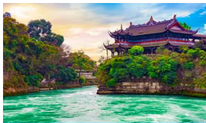
เขื่อนตูเจียวเยี่ยน

พักที่ MAOXIAN INTER HOTEL โรงแรมระดับ 4 ดาวหรือเทียบเท่าในเมืองเม่าเจี้ยน