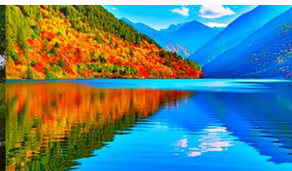
ทะเลสาบแพนต้า