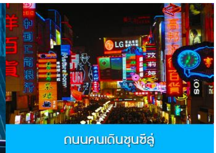
ถนนคนเดินชุนชี่ลู่