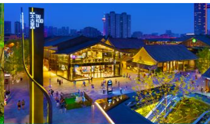
ถนนไท่กู่หลี่ และวัดต้าเจี๊ว