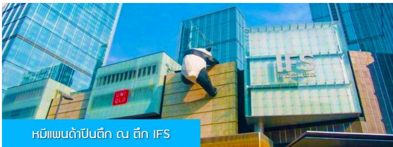
หมีแพนด้าปีนตึก ณ ตึก IFS