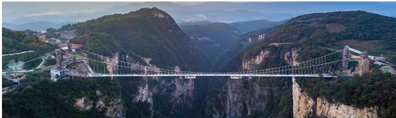
สะพานกระจกจางเจียเจี๋ย

อัตราค่าบริการสำหรับโปรแกรมเสริมการแสดงชุด The love Story of Wooden man and Fairy Fox ท่านละ 400 หยวน (หรือ 2,000 บาทขึ้นอยู่กับอัตราแลกเปลี่ยน) ระยะเวลาที่ใช้ในการเที่ยวชมการแสดง ประมาณ 3 ชั่วโมง รวมเวลาเดินทางไป กลับค่าบริการรวม ค่าบัตรเข้าชม ค่ารถรับ ส่ง และค่าน้ำเที่ยวของไกด์ท้องถิ่นพักที่ GUIYUANZHENPIN HOTEL โรงแรมระดับ 4 ดาวหรือเทียบเท่าในอุทยานหวู่หลิงหยวน