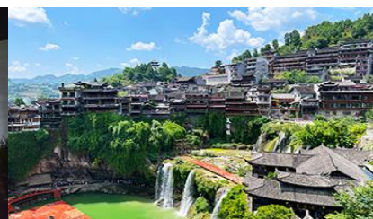
เมืองโบราณผู่หมวกเงิน