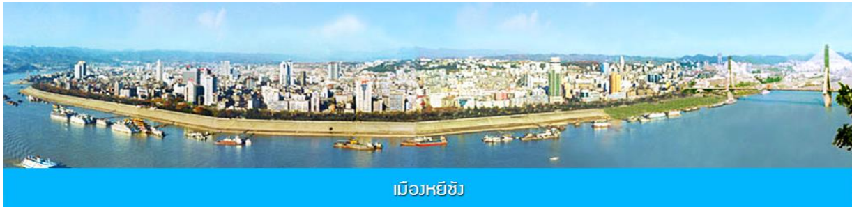
เมืองหยีชัง