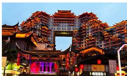
ตึกมหิศวรรษย์ 72 ชั้น

พักที่ ZHENMIAN HOTEL โรงแรมระดับ 4 ดาวหรือเทียบเท่าในเมืองจางเจียงเจี๋ย