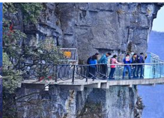
หน้าพลาวยฟ้าทางเดินกระจก