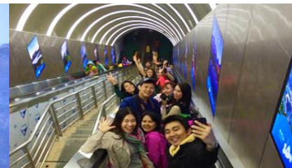
บันไดเลื่อนทะลุภูเขา