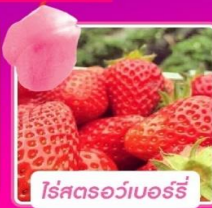
โรสตรอว์เบอร์รี่