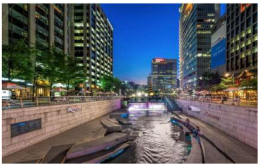
ทางเดินอย่างสวยงาม

ตลาดอาหารควังจัง สัมผัสวัฒนธรรมอาหารท้องถิ่นของเกาหลี กำลังเป็นที่นิยมของคนเกาหลี ไอดอล ยูทูบเบอร์ไปถ่ายทำจำนวนมาก มีอาหารสไตล์ท้องถิ่นให้เลือกทานมากมาย ได้ บรรยากาศความเป็นเกาหลีที่แท้จริง