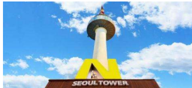
คืนได้แบบ 360 องศา

สวนสนุกล็อตเต้เวิลด์ สวนสนุกในร่มที่มีเครื่องเล่นมากมาย โดยพื้นที่ภายในจะแบ่งเป็น 2 โซนใหญ่ๆ คือ Adventure เป็นสวนสนุกในร่มที่รวมเครื่องเล่นไว้มากมาย ทั้งไวกิ้ง ม้าหมุน บ้านผีสิง ฯลฯ รวมถึงมีลานไอซ์สเก็ตในร่มอีกด้วย ส่วนอีกโซนชื่อว่า Magic Island เป็นโซนกลางแจ้ง อยู่ติดกับทะเลสาบชอกซอนโฮชู มีปราสาทสวยๆ ตั้งเด่นเป็นสง่า ตรงนี้แหละคะเป็นจุดถ่ายรูปที่คนเกาหลีฮิตมากๆ ถ้าจะให้ปังสุดๆ ต้องเช่าชุดนักเรียนน่ารักๆ มาใส่ถ่ายรูปด้วยนะ โซนกลางแจ้งมีเครื่องเล่นไฮไลท์เป็น Gyro Drop ดรอปทาวเวอร์ สูง 70 เมตร และเครื่องเล่นมันส์ๆ อีกมากมาย ใครชอบความท้าทายต้องไม่พลาด