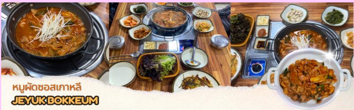
หมูผัดซอสเกาหลี JEYUK BOKKEUM

เที่ยง 🍴 รับประทานอาหารเที่ยง (มื้อที่ 1) แฉุกบ็อกกิม หรือหมูผัดซอสเกาหลี เป็นอาหารที่คนเกาหลีนิยมทานพอๆ กับเมนูยอดฮิตอย่างบูลโกกิ รสชาติเผ็ดนิดๆหวานหน่อยๆ รับประทานคู่กับข้าวสวยร้อนๆ หรือวางหมูลงบนผักสด พร้อมด้วยเครื่องเคียงต่างๆ หรือสามารถห่อเป็นคำรับประทานได้ตามใจชอบ