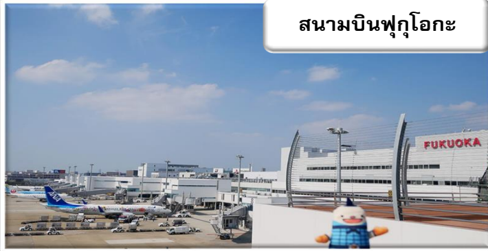
สนามบินฟุกุโอกะ

เวลา 07.05 น. เดินทางถึง สนามบินฟุกุโอกะ ประเทศญี่ปุ่น นำท่านผ่านขั้นตอนการตรวจคนเข้าเมืองและศุลกากร เวลาญี่ปุ่น เร็วกว่าประเทศไทย 2 ชั่วโมง