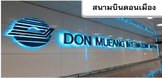
สนามบินดอนเมือง

เวลา 20.30 น. พร้อมกันที่ ท่าอากาศยานดอนเมือง อาคารผู้โดยสารขาออกระหว่างประเทศ เคาน์เตอร์สายการบินไทยแอร์เอเชีย เจ้าหน้าที่คอยให้การต้อนรับดูแลด้านเอกสาร เช็คอิน และสัมภาระในการเดินทาง เวลา 23.25 น. ออกเดินทางสู่ สนามบินฟุกุโอกะ ประเทศญี่ปุ่น โดยสายการบินไทยแอร์เอเชีย เที่ยวบินที่ FD 236