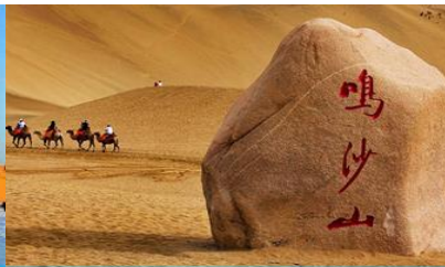
เนินทรายหมิงซาซาน