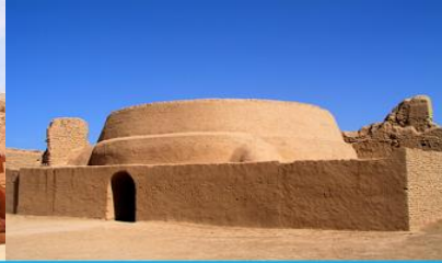
เมืองโบราณเกาซางกู่เจิง