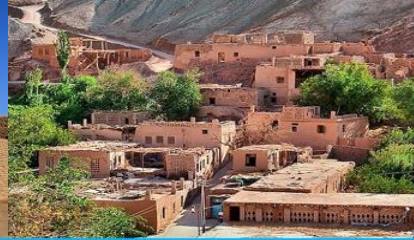
หมู่บ้านอูยгур์

วันที่หก ชมระบบชลประทานอู่หลู่ฟาน – ถ้ำพระพันองค์- เมืองโบราณเกาซางกู่เจิง-หมู่บ้านอูยгур์ –เดินทางสู่เมืองอูรูมูฉี