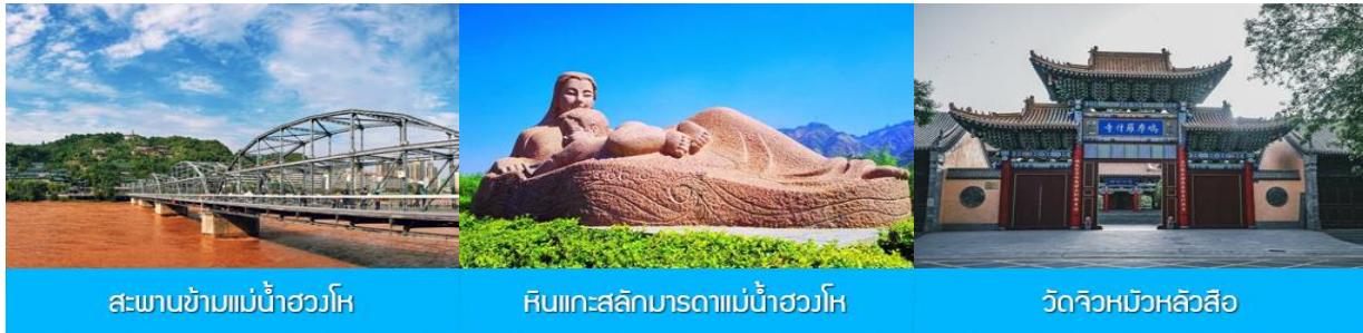
สะพานข้ามแม่น้ำฮวงโห