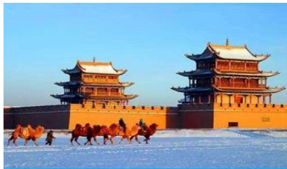
ด่านเจียชวี่กวน

พักที่ REZEN HOTEL ระดับ 4 ดาวห้องดีนหรือเทียบเท่าในเมือง เจียชวี่กวน