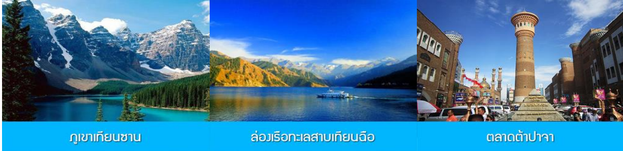
ภูเขากิยงซาน

พักที่ HAMPTON BY HILTON URUMQI HOTEL โรงแรมระดับ 4 ดาวหรือเทียบเท่าในเมืองอูรูมฉี