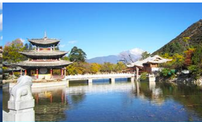
สระน้ำมังกรดำ