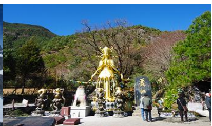
อุทยานน้ำหยก

วันที่สี่ ภูเขาหิมะมังกรหยก (รวมถ้ำน้ำกระเซ็นใหญ่) – โชว์ IMPRESSION LIJIANG – อุทยานน้ำหยก-ต้าหลี่ ออฟชั่นเลือกซื้อ หุบเขาพระจันทร์สีน้ำเงิน น้ำตกป๋อสู๋เหอ