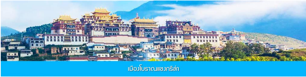
เมืองโบราณแซกริลา

เมื่อเสร็จจากการเที่ยวชมช่องแคบเสือกกระโจน นำท่านเดินทางต่อสู่เมือง แซกริลา ซึ่งอยู่ทางทิศ ตะวันออกเฉียงเหนือของมณฑลยูนนาน ซึ่งมีพรมแดนติดกับอาณาเขตนาซี ของเมืองลี่เจียง และ อาณาจักรหยาี ของเมืองหนิงหลง สถานที่แห่งนี้จึงได้ชื่อว่า ดินแดนแห่งความฝันที่ตั้งอยู่บนที่ราบสูง ทางทิศตะวันตกเฉียงใต้ของจีน