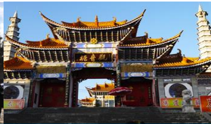
วัดเจ้าแม่กวนอิมแปดภพ