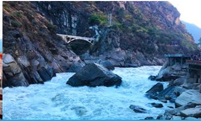
ช่องแคบเสือกระโจน