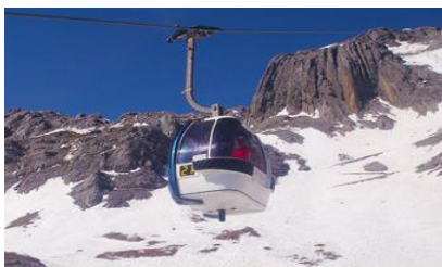
ภูเขาหิมะมังกรหยก (บ่อน้ำใหญ่)

ที่พัก FENG HUANG HOTEL ระดับ 4 ดาว หรือเทียบเท่าเมืองลี่เจียง