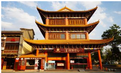
เมืองโบราณกวนตุ๋

พักที่ REGENT HOTEL ระดับ 4 ดาว หรือเทียบเท่าในเมืองต้าหลี่