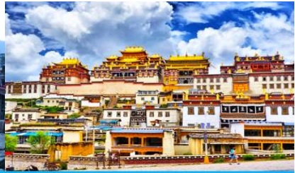
เมืองเซงการีล่า

วันที่สอง เมืองคุนหมิง-นั่งรถไฟความเร็วสูงสู่เมืองต้าหลี่-ช่องแคบเสือกระโจน-จงเตี้ยน-เมืองโบราณเซงการีล่า