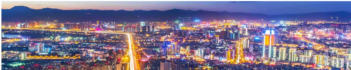
นครคุนหมิง