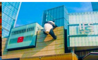
หมีแพนด้าปิ่นตึก ณ ตึก IFS