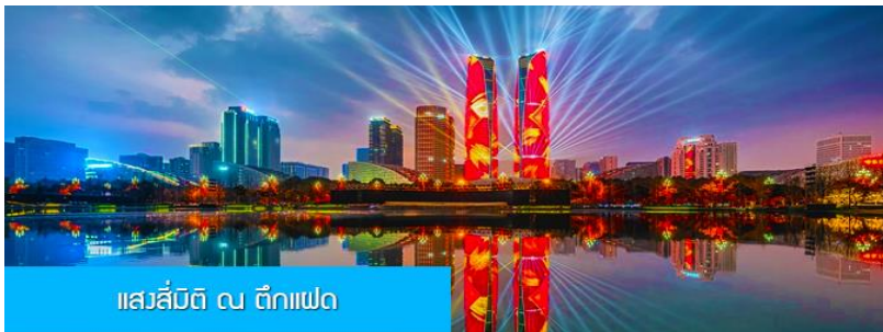
แสลงลี่มิตี ณ ตึกแฝด