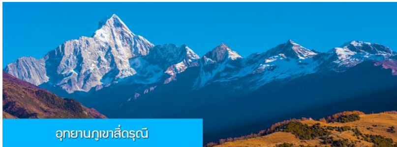
อุทยานภูเขาสี่ครุณี

หลังอาหารเช้าท่านเที่ยวชม หุบเขาชวงเฉียวโกว 双桥沟景区 ที่เป็นแหล่งท่องเที่ยวที่สวยงามที่สุดแห่งหนึ่งในเขตอุทยานภูเขาสี่ครุณี นำท่านนั่งรถบัสของอุทยานที่วิ่งไปผ่านเส้นทางที่สร้างคู่ขนานกับธารกษยในหุบเขา ท่านจะได้สัมผัสกับความสวยงามของทัศนียภาพธรรมชาติที่หาชมได้ยาก โดยมีภูเขาหิมะสูงตระหง่านอยู่เบื้องหลัง ธารน้ำใสไหลริน และสระน้ำที่มีสีเขียวมรกต ในฤดูใบไม้ผลิและฤดูร้อนท่านจะได้เห็นฝูงจามรีท่ามกลางทุ่งหญ้าเขียวขจี ส่วนในฤดูหนาวทุ่งหญ้าและพื้นดินจะปกคลุมด้วยพรมหิมะสีขาว....รถบัสของอุทยานจะนำนักท่องเที่ยวไปยังจุดชมวิวสำคัญต่าง ๆ ภายในเขตอุทยาน เพื่อให้นักท่องเที่ยวได้เที่ยวชมสถานที่และถ่ายรูปตามอัธยาศัย จนครบเวลา นำคณะขึ้นรถบัสออกจากอุทยาน