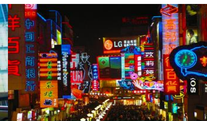
ถนนคนเดินชุนชี่ลู่