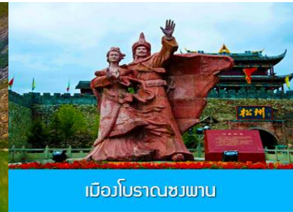
เมืองโบราณชวงพาน