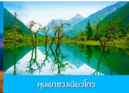
หุบเขาชวงเฉียวโกว