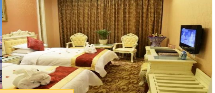
DUNGHUANG: GRAND SUN HOTEL