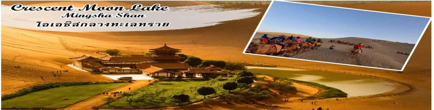
Crescent Moon Lake Mingsha Shan โอเอซิสกลางทะเลทราย