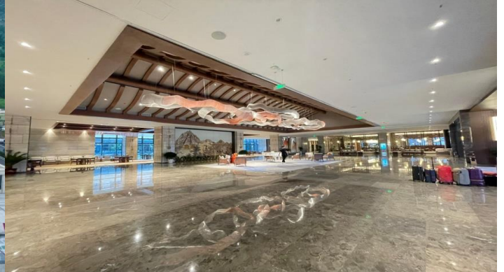
TIANSHUI: MAIJISHAN PEARL HOTEL