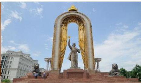
อนุสาวรีย์อิสมาอิล ซามานี