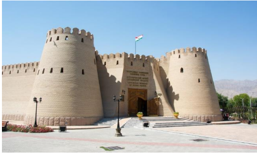
ปราสาททาเมมาริค

นำท่านเข้าสู่ที่พัก Parliament Palace Hotel หรือเทียบเท่า