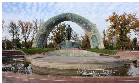
สวนสาธารณะรูดากี