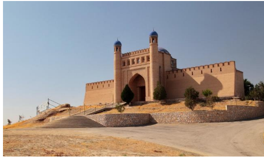
ป้อมปราการมัคเทปเป

นำท่านเข้าสู่ที่พัก Atlas Hotel หรือเทียบเท่า