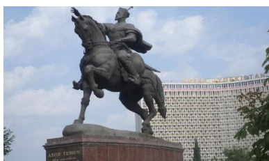
จัตุรัสอามิร์ تیمูร์

13.10 น. เดินทางถึง สนามบินเมืองทาชเคนท์ (Tashkent International Airport) หลังผ่านพิธีตรวจคนเข้าเมืองและศุลกากรแล้ว นำท่านเดินทางเข้าสู่ เมืองทาชเคนท์ (Tashkent) เป็นเมืองหลวงที่ตั้งอยู่ทางทิศตะวันออกของประเทศ มีความหมายว่า เมืองแห่งศิลา (The City of Stone) เป็นเมืองที่ใหญ่ประกอบไปด้วยโรงงานอุตสาหกรรมและเป็นศูนย์กลางของวัฒนธรรมในเอเชียกลาง มีประชากรประมาณ 2 ล้านคน นำท่านชมความสวยงามของเมืองหลวง ซึ่งตั้งอยู่บนเส้นทางสายไหมจากจีนสู่ยุโรป นำท่านชม จัตุรัสเสรีภาพ หรือ จัตุรัสมุสตาคิลลิค (Independence Square หรือ Mustakillik Square) เป็นหัวใจของเมืองและเป็นสัญลักษณ์แห่งอิสรภาพของคนในชาติ ชม จัตุรัสอามิร์ تیمูร์ (Amir Timur Square) หัวใจตัวอนุสาวรีย์ทำจากสัมฤทธิ์ เป็นรูป تیمูร์ประทับบนหลังม้าอย่างสง่าผ่าเผย แล้วนำ ชมโรงเรียนสอนศาสนาบาร์กข่าน (Barak Khan Madrasedh) จากนั้นนำท่านสัมผัสความงดงามของกลุ่มสถาปัตยกรรม Hazrati Imam Complex ซึ่งเป็นสถานที่ศักดิ์สิทธิ์เก่าแก่ของชาวมุสลิมที่มีมาตั้งแต่ศตวรรษที่ 6 ประกอบไปด้วยสิ่งปลูกสร้างที่ยิ่งใหญ่ เช่น มัสยิดโรงเรียนสอนศาสนาและพิพิธภัณฑ์ที่เก็บรวบรวมคัมภีร์กูรอ่านเก่าแก่ไว้มากมาย อีกทั้งยังเป็นที่เกิดบรึกษาคัมภีร์กูรอ่านที่มีขนาดใหญ่ที่สุดอีกด้วย จากนั้นนำท่านไป ตลาดคอร์ดุซ (Chorsu Bazaar) ซึ่งครั้งหนึ่งเคยเป็นตลาดที่ยิ่งใหญ่ในเอเชียกลางและบนเส้นทางสายไหมที่อยู่ภายใต้โดม 7 โดมขายผลิตภัณฑ์ต่างๆ สัมผัสกับบรรยากาศแบบย้อนยุค พร้อมเลือกซื้อสินค้าในตลาดบาซาร์ที่มีทั้งผ้าแพร พรม เครื่องทองเหลือง ผ้าขนสัตว์ เครื่องหนัง และสินค้าพื้นเมืองมากมาย