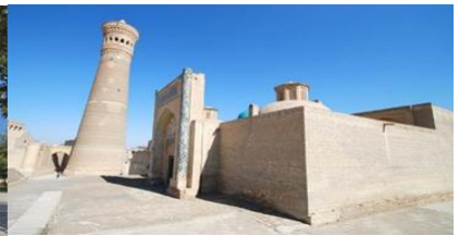
หอโพลี คัลยาน

เที่ยง บริการอาหารกลางวัน ณ ภัตตาคาร บ่าย นำท่านเดินทางสู่สถานีรถไฟ เพื่อโดยสารรถไฟสู่เมืองทาสเคนท์ 14.34 น. นำท่านโดยสารรถไฟความเร็วสูง เดินทางสู่เมืองทาสเคนท์ 18.48 น. ถึง สถานีรถไฟเมืองทาสเคนท์ แล้วนำท่านเดินทางสู่สนามบินทาสเคนท์ (บริการอาหารค่ำ-กล่อง) 22.30 น. ออกเดินทางกลับสู่ กรุงเทพฯ โดยเที่ยวบินที่ HY 532 (รับประทานอาหารและพักผ่อนบนเครื่องบิน)