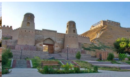
ป้อมปราการฮิสซาร์