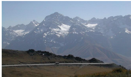
ช่องเขาแอนซอพพาส