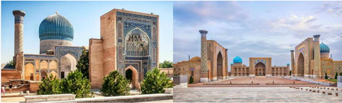
สถานที่ฝังศพอาเมียร์