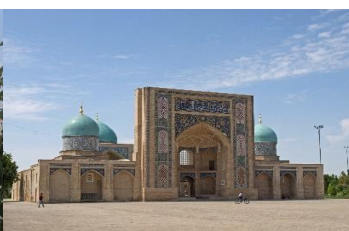
Hazrati Imam Complex