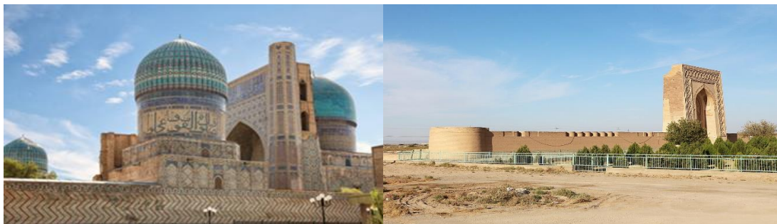
สุเหร่าบิบี คะนูน

บ่าย ออกเดินทางต่อสู่ เมืองบูคาร่า Bukhara (ระยะทาง 276 ก.ม./4.30 ชม. ระหว่างทางแวะ คาราวานซารายราบาติ มาลิก (Rabati Mallik Caravanserai) ถูกสร้างขึ้นมาเพื่อให้เป็นที่พักแรมของกองคาราวานบนเส้นทางสายไหมตามคำสั่งของ คาราคานิด ชามส์ อัล มัคนาสร์ บุตรชายของ ทัมกาชข่าน อิบรากิม ผู้ปกครองดินแดนซามาร์คานด์ตั้งแต่ปี ค.ศ. 1068-1088 เป็นโบราณสถานที่มีค่าที่สุดทางด้านประวัติศาสตร์ในดินแดนแห่งตะวันออกกลาง และได้รับการขึ้นทะเบียนเป็นมรดกของโลกในปี ค.ศ.2008 ราบาติ มาลิก เป็นสถานที่ที่มีความพิเศษในด้านประวัติศาสตร์ของสถาปัตยกรรมเปอร์เซียโบราณมีพื้นที่กว้างใหญ่ประมาณ 8,277 ตารางเมตร โดยเฉพาะประตูทางเข้าด้านหน้าได้ถูกสร้างขึ้นอย่างวิจิตรและมีการตกแต่งอย่างสวยงามด้วยลวดลายของส่วนโค้งที่ถูกก่อสร้างขึ้นด้วยก้อนอิฐที่มีขนาดใหญ่ แต่ละก้อนที่วัดได้ ขนาด 25x25x4 ซม. และขอบประตูยังถูกตกแต่งด้วยรูปดาวแปดเหลี่ยมที่ต่อกันอย่างสวยงามไปยังส่วนด้านบนของประตูและต่อลงมาทางด้านล่างของอีกด้านหนึ่ง