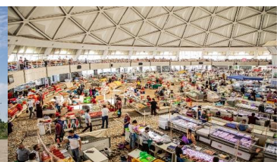
ตลาดคอร์ดุซ