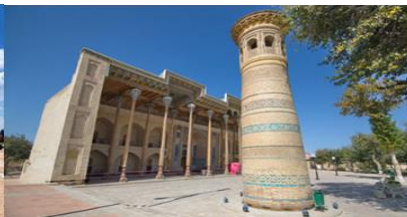
สุเหร่าไม้