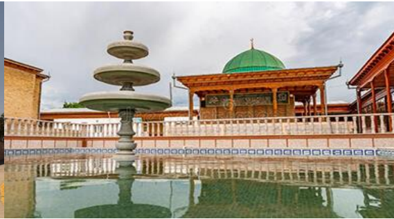
กลุ่มอาคาร khazratl shoh