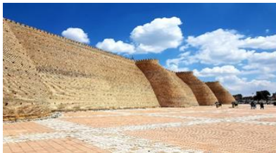
ป้อมติอาร์ค

เช้า บริการอาหารเช้า ณ ห้องอาหารของโรงแรม นำท่านชม ด้านนอกและถ่ายรูปกับ ป้อมติอาร์ค ป้อมปราการแห่งบูคาร่า (Ark of Bukhara) ซึ่งเป็นป้อมเก่าแก่สร้างในศตวรรษที่ 5 ตั้งอยู่ใจกลางเมือง และเมื่อขึ้นไปด้านบนของป้อมจะสามารถเห็นวิวทิวทัศน์ของเมืองได้อย่างชัดเจน มีกำแพงล้อมรอบมีความยาวประมาณ 800 เมตร ส่วนของกำแพงมีความสูงถึง 16-20 เมตร ถูกสร้างด้วยอิฐหนาที่บดและสูงใหญ่ ส่วนประตูมีซุ้มโค้งและหอคอยทั้งสองด้าน ซึ่งในอดีตภายในถูกใช้เป็นศูนย์กลางการปกครอง ชม สุเหร่าไม้ (Bolo Hauz Mosque) เป็นอาคารสุเหร่าในสมัยกลาง ถูกสร้างขึ้นปี ค.ศ. 1712-1713 รูปแบบในการก่อสร้างประกอบไปด้วยเสาไม้ที่มีความสูงมาก อาคารด้านหน้ามีเสาไม้ประดับมากกว่า 20 ต้นรองรับแดดฟ้าหลังคา ต่อมาในปี ค.ศ. 1917 ก็ได้ใช้สถานที่แห่งนี้เป็นสุเหร่าอย่างเป็นทางการมาจนถึงปัจจุบันนี้ ชม หอโพลี คัลยาน (Poli Kalyan Ensemble and Kalon Minaret) ถูกสร้างขึ้นใน ปี ค.ศ. 1127 โดย อาสลาฮัน ข่าน แห่งราชวงศ์คารานิด อยู่ในการปกครองของบูคาร่า และสามารถทำให้ผู้พบเห็นต้องตกตะลึงถึงความโอ่างดงามในรูปร่างของหอนี้ ส่วนที่สูงที่สุดเป็นทรงกลม หอนี้ได้ถูกออกแบบเพื่อใช้ในการทำละหมาดของชาวมุสลิม หอคอยแห่งนี้ได้ถูกซ่อมแซมขึ้นใหม่ในศตวรรษที่ 15