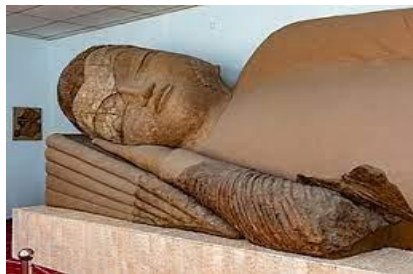
พิพิธภัณฑโอบราณวัตถุแห่งชาติ

นำท่านเข้าสู่ที่พัก Atlas Hotel หรือเทียบเท่า