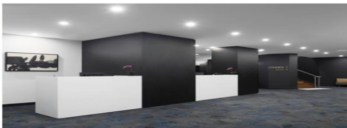
(โรงแรมย่านกลางเมือง ใกล้แหล่งช้อปปิ้ง เดินทางสะดวก) *รูปภาพเพื่อการโฆษณา*

วันที่สาม เมลเบิร์น - Gibson Steps – 12 APOSTLES (ครึ่งสาย) - London Bridge –เมลเบิร์น