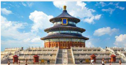
หอบูชาฟ้าเทียนถาน