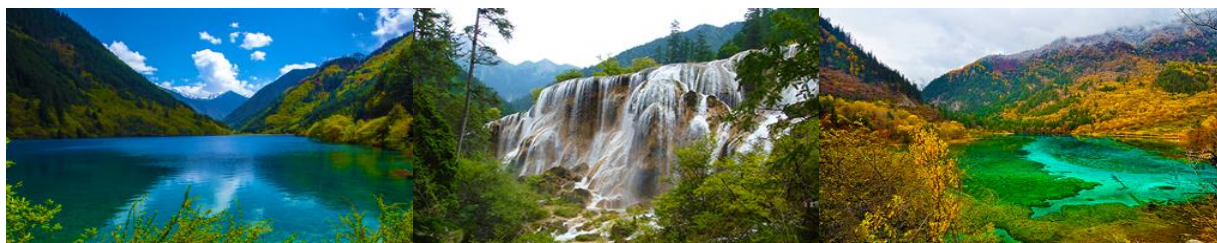
ทะเลสาบแรด (RHINO LAKE)

หลังอาหารเช้านำท่านเดินทางสู่ อุทยานแห่งชาติจิวจี้โกว (JIUZHAIYOU NATIONAL PARK) ตั้งอยู่ด้านทิศเหนือของมณฑลเสฉวน ซึ่งเป็นส่วนหนึ่งในบริเวณตอนใต้ของเทือกเขาหิมิงซาน ห่างออกไปจากตัวเมืองเฉิงตูราว 500 กิโลเมตร จิวจี้โกวมีชื่อเสียงด้านความงามแห่งสีสันที่แปลกเปลี่ยนไม่รู้จบ ทะเลสาบผุดขึ้นท่ามกลางหมอกเมฆไม้เขียวขจี น้ำใสเป็นประกายชุ่มฉ่ำ ยอดเขาหิมะตัดกับท้องฟ้าสีคราม เกิดเป็นภาพธรรมชาติอันงดงามที่แปรเปลี่ยนไปตามฤดูกาลผลิ ด้วยความสวยงามจึงทำให้อุทยานแห่งชาติจิวจี้โกว ได้ถูกขึ้นทะเบียนเป็นมรดกโลกทางธรรมชาติ ในปี.ศ. 1992