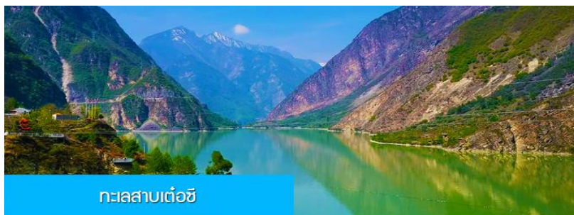
ทะเลสาบเต๋อซี

พักที่ MINJIANG HOTEL 5* หรือ โรงแรมระดับ 5 ดาวท้องถิ่น