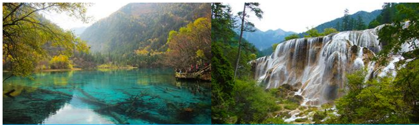
อุทยานจิวจี้โกว