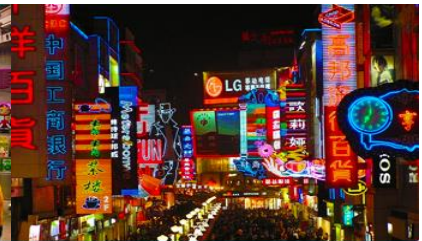
ถนนคนเดินชุนชิว