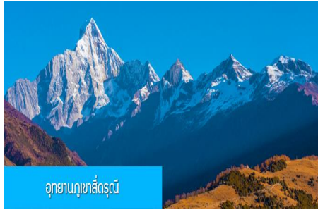
อุทยานภูเขาสิ่วตุนี