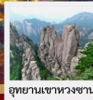
อุทยานเขาหวงซาน