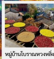
หมู่บ้านโบราณหวงหลิง