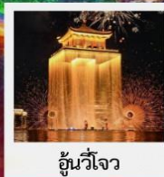
อู๋นวิโจว