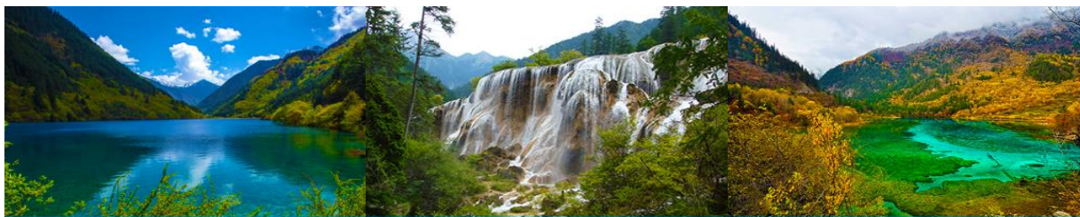
ทะเลสาบไธรา (RHINO LAKE)

หลังอาหารเช้า นำท่านเดินทางสู่ อุทยานแห่งชาติจิวจ้ายโกว 九寨沟景区 ตั้งอยู่ด้านทิศเหนือของมณฑลเสฉวน ซึ่งเป็นส่วนหนึ่งในบริเวณตอนใต้ของเทือกเขาหิมิงซาน ห่างออกไปจากตัวเมืองเฉิงตูราว 500 กิโลเมตร จิวจ้ายโกวมีชื่อเสียงด้านความงามแห่งสีสันที่แปลกเปลี่ยนไม่รู้จบ ทะเลสาบผุดขึ้นท่ามกลางหมอกเมฆไม้เขียวจี น้ำใสเป็นประกายชุ่มฉ่ำ ยอดเขาหิมะตัดกับท้องฟ้าสีคราม เกิดเป็นภาพธรรมชาติอันงดงามที่แปรเปลี่ยนไปตามฤดูกาลผลิ ด้วยความสวยงามจึงทำให้อุทยานแห่งชาติจิวจ้ายโกว ได้ถูกขึ้นทะเบียนเป็นมรดกโลกทางธรรมชาติในปีค.ศ. 1992