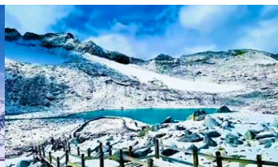
ทะเลสาบต้ากู๋

วันที่ ชวนจู่ซือ –เมืองเหยสู่ย-อุทยานภูเขาหิมะการ์เซียต้ากู๋ปิงชเวน (รวมค่ากระเช้าขึ้น-ลง) - รถเมล์ในอุทยาน- เหยสู่ย