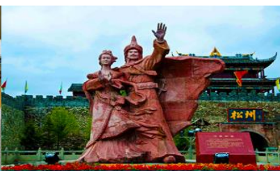
เมืองโบราณซงพาน