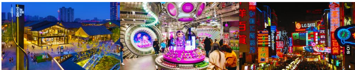
ถนนไท่กุ่หลี่ และวัดต้าฉือ

พักที่ โรงแรม SERENGETI HOTEL ระดับ 4 ดาวห้องดีนหรือเทียบเท่า