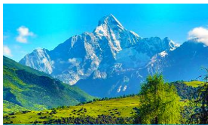
อุทยานภูเขาสี่ดรุณี

ค่ำ รับประทานอาหารค่ำ ณ ภัตตาคาร พักที่ SI GUNIANG SHAN HOTEL 4* หรือระดับ4ดาวพื้นเมือง