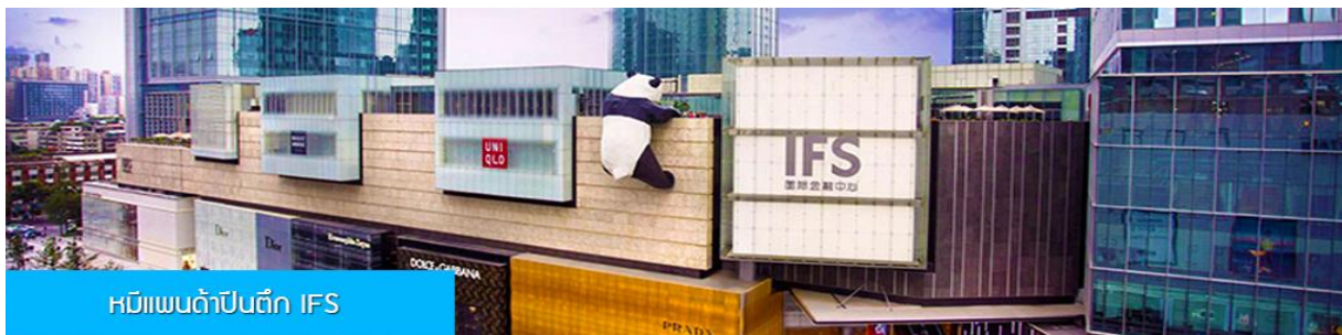
หมีแพนด้าปีนตึก IFS

ชม หมีแพนด้าปีนตึก ณ ตึก IFS 熊猫爬楼 จุดเช็คอินใหม่สำหรับชาวเมืองเฉิงตูและนักท่องเที่ยวผู้มาเยือน ท่านจะได้ตะลึงกับตึกตึกยักษ์ที่มีความสูง 15 เมตร น้ำหนัก 13 ตัน ปีนเกาะอยู่บนยอดตึก IFS ใจกลางเมืองเฉิงตู.