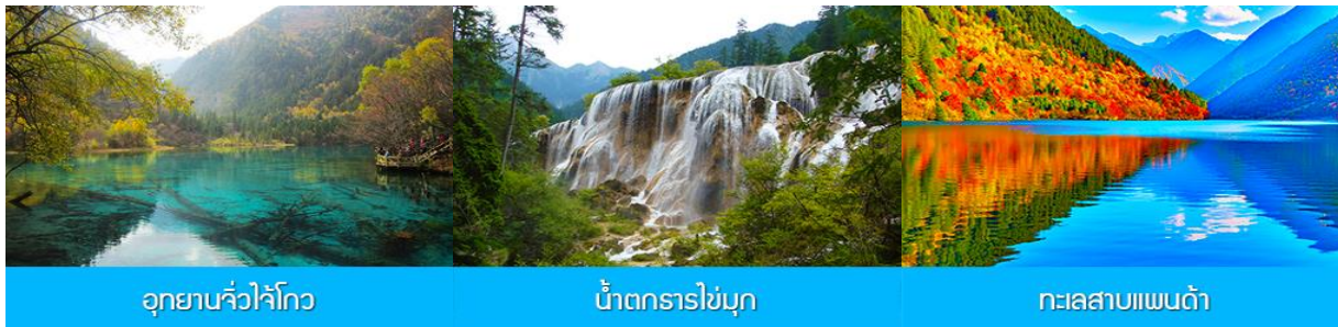
อุทยานจิวจ้ายโกว

พักที่ โรงแรม JIUYUAN HOTEL ระดับ 4 ดาวห้องดีนหรือเทียบเท่าในอุทยานจิวจ้ายโกว