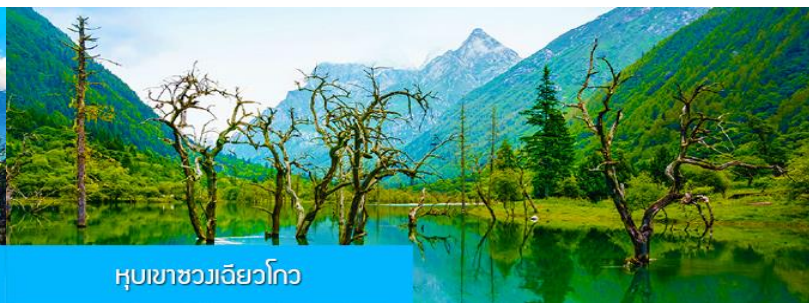
หุบเขาชวงเฉียวโกว