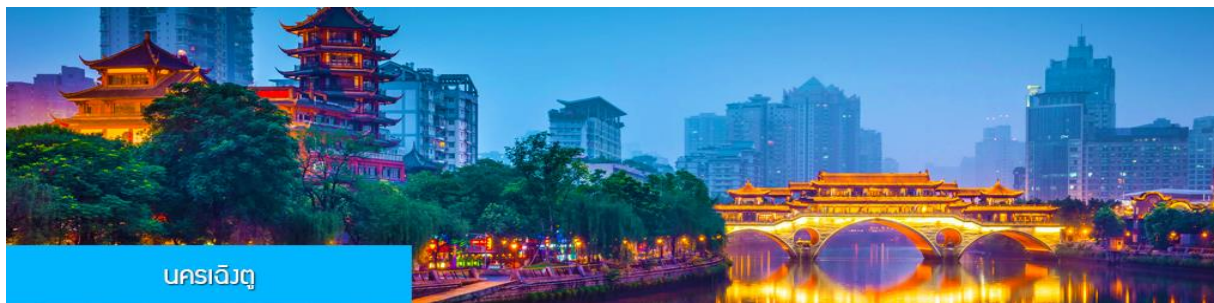
นครเจิ้งตู