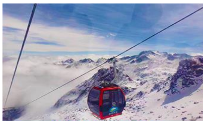
นั่งกระเช้าสู่อุทยานสวรรค์ ภูเขาคิมะการ์เซียต้ากู๋