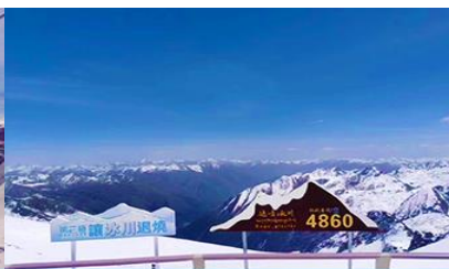
อุทยานสวรรค์ภูเขาคิมะการ์เซียต้ากู๋