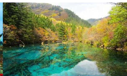
อุทยานจิวจ้ายโกว