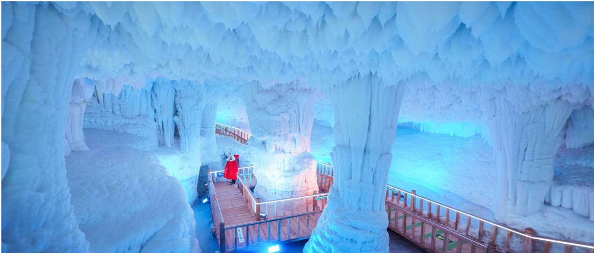
นักท่องเที่ยวจะต้องสวมชุดและหมวกนิรภัย และเดินเรียงแถว เนื่องจากทางแคบและลื่น จึงต้องใช้ความระมัดระวังเป็นพิเศษ **

เช้า บริการอาหารเช้า ณ ห้องอาหารของโรงแรม นำท่านเดินทางสู่เขตอุทยานยูชิวซาน เข้าชมถ้ำน้ำแข็งหมื่นปี ภูเขาหยุนเฉิงสร้างภูมิประเทศที่เป็นเอกลักษณ์และทิวทัศน์แปลกตาของยอดเขาต่างๆ เรียกได้ว่า "ชิงแช่มป์พันยอด หลายพันลำ" อย่างไรก็ตาม เมื่อมาถึงภูเขาหยุนเฉิง ถ้ำน้ำแข็งขนาดใหญ่ที่ควรค่าแก่การชมมากที่สุดคือกลุ่มถ้ำน้ำแข็งขนาดใหญ่ที่หายากที่สุดในโลก หลังจากการสำรวจและพัฒนา 16 ปี ถ้ำน้ำแข็ง Yunqiushan เปิดให้บริการแก่ประชาชนทั่วไปเมื่อปลายปี 2018 กลุ่มน้ำแข็งเป็นหนึ่งในสามถ้ำน้ำแข็งของโลกที่มีอายุ 300 ล้านปีและเป็นกลุ่มน้ำแข็งธรรมชาติที่ใหญ่ที่สุดที่พบในประเทศ