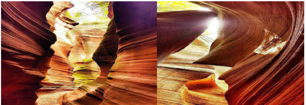
ข้อแนะนำในการเยี่ยมชม : ในหุบเขากว้างท่านสามารถเดินเคียงข้างกันได้หลายคน แต่ในช่วงที่อยู่ในหุบเขาแคบ ๆ กรุณาเดินเป็นแถวคนเดียวเท่านั้น ในช่วงฤดูฝนระหว่างเดือนมิถุนายน - สิงหาคม กรณีมีฝนตก ขอสงวนสิทธิ์ในการยกเลิกการเข้าชมเนื่องจากอาจมีน้ำไหลเชี่ยวไม่ปลอดภัย

เช้า บริการอาหารเช้า ณ ห้องอาหารของโรงแรม นำท่านเดินทางไปยัง แกรนด์แคนยอนยูนาโกว ซึ่งได้รับการยกย่องว่าเป็นรอยแตกตามธรรมชาติที่มหัศจรรย์ของที่ราบสูง เทียบได้ว่าเป็นแกรนด์แคนยอน Antelope Canyon ในสหรัฐอเมริกาเวอร์ชันจีน มีหุบเขาขนาดเล็ก 4 แห่ง ได้แก่ Longbagou, Huabaogou, Nanhegou และ Huashugou หุบเขาแต่ละแห่งมีลักษณะเฉพาะของตัวเอง ให้ท่านได้สัมผัสความมหัศจรรย์ของธรรมชาติ ที่แกะสลักช่องเขาด้วยสายน้ำสายลมและแสงแดดที่แผดเผา ผ่านเวลานับล้านปี เกิดเป็นช่องเขาที่สวยงามเรียงบ่ง่ายกลมกลืนเป็นธรรมชาติ ในบางครั้งที่มีแสงแดดส่องลงมายังหุบเขา จะทำให้ชั้นหินมีสีสรรคและเกิดแสงเงาที่สวยงาม ทำให้การเดินทางในหุบเขามีความรู้สึกเหมือนมีคลื่นทะเลพัดผ่านดูสวยงาม