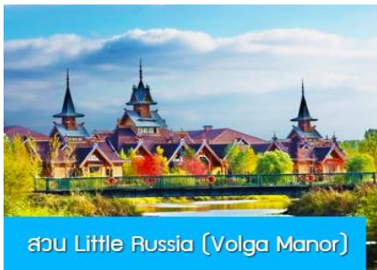
สวน Little Russia (Volga Manor)