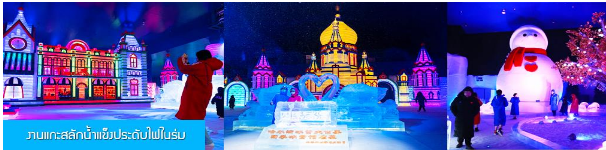
งานแกะสลักน้ำแข็งประดับไฟในร่ม