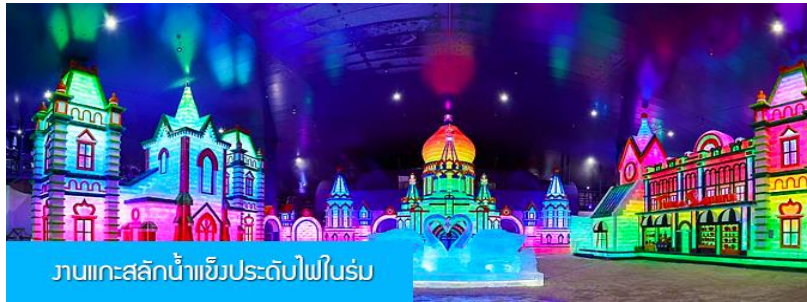
งานแกะสลักน้ำแข็งประดับไฟในร่ม