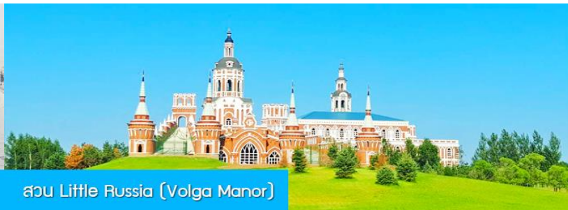
สวน Little Russia (Volga Manor)