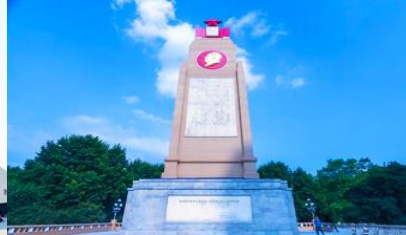
อนุสาวรีย์พิงหว