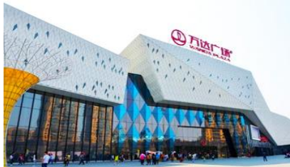
ห้างว๋านต้าสแควร์

พักที่ โรงแรม HARBIN REZEN HOTEL โรงแรมระดับ 4 ดาวท้องถิ่นหรือเทียบเท่าในเมืองฮาร์บิน