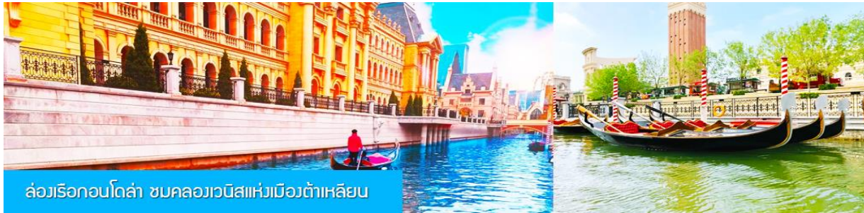
ล่องเรือกอนโดลา ชมคลองเวนิสแห่งเมืองต้าเหลียน