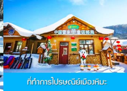
ที่ทำการไปรษณีย์เมืองหิมะ

วันที่สี่ พิพิธภัณฑ์เมืองหิมะ – ที่ทำการไปรษณีย์เมืองหิมะ – ไกด์ขายออฟชั่น ภาพเขียนสิบลี้-และ ออฟชั่น ม้าลากเลื่อน-เมืองฮาร์บิน