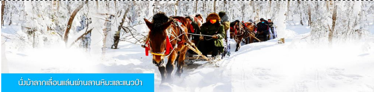
นั่งม้าลากเลื่อนเล่นผ่านลานหิมะและแนวป่า

220 หยวน หรือ 1100 บาท อัตรานี้รวมค่าบัตรผ่านเข้าอุทยาน ค่ารถรับ ส่ง และค่าบริการของไกด์ท้องถิ่น และค่าบริหารจัดการของบริษัททัวร์ท้องถิ่น หมายเหตุ โปรแกรมเสริมเป็นโปรแกรมที่ท่านต้องเสียค่าใช้จ่ายเองด้วยความสมัครใจ สำหรับท่านที่ไม่เข้าร่วมกิจกรรมดังกล่าวสามารถนั่งพักในรถได้