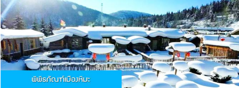
พิพิธภัณฑ์เมืองหิมะ

หมายเหตุ การไปพักในเมืองหิมะทางทัวร์ไม่สามารถจัดรถทัวร์ไปส่งลูกค้าถึงหน้าโฮมสเตย์ได้ ทางคณะต้องนั่งรถเมล์หมู่บ้านเข้าไป โดยลูกค้าต้องถือหรือลากกระเป๋าเข้าที่พักด้วยตัวเอง เพราะโฮมสเตย์จะไม่มีพนักงานยกกระเป๋า มาคอยบริการยกกระเป๋าให้ผู้เข้าพัก ท่านควรจัดเตรียมกระเป๋าใบเล็กที่บรรจุเสื้อผ้า และเครื่องใช้จำเป็นสำหรับการพักผ่อน ณ โฮมสเตย์ในเมืองหิมะในครั้งนี้ เพื่อสะดวกต่อการเคลื่อนย้ายกระเป๋า, และภายในห้องพักจะไม่มีผ้าเช็ดตัวผืนใหญ่ จะมีเพียงสบู่ แชมพูบริการทุกโรงแรม ท่านควรเตรียมแปรงสีฟันยาสีฟันติดไปด้วย