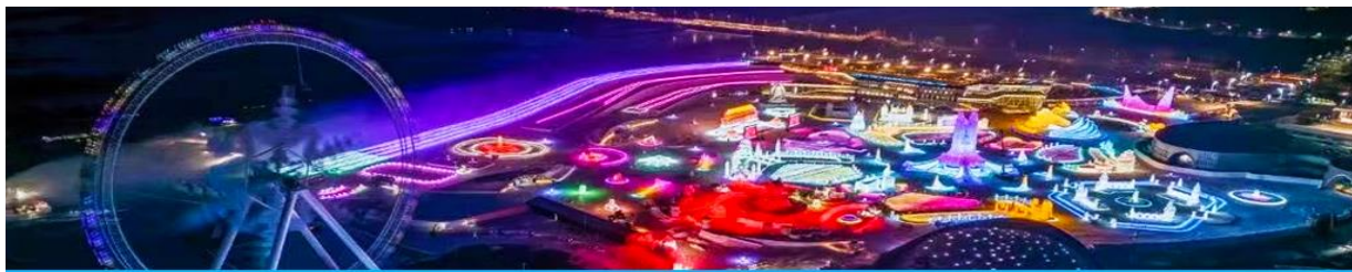
เทศกาลแกะสลักน้ำแข็งนานาชาติ

หลังอาหารนำท่านเที่ยวชมงาน เทศกาลแกะสลักน้ำแข็งนานาชาติ 冰雪大世界 Harbin 2025 International Ice and Snow Festival งานนิทรรศการและการศิลปกรรมแกะสลักนานาชาติประจำปีที่ยิ่งใหญ่และอลังการ ด้วยสภาพอากาศที่หนาวเย็นในช่วงฤดูหนาวของเมืองฮาร์บิน ที่นี้ได้กลายเป็นลานประกวดประติมากรรมน้ำแข็งกลางแจ้งที่ใหญ่และมีชื่อเสียงที่สุดของโลก ให้ท่านได้เดินเที่ยวชมความสวยงามตระการตาของประติมากรรมน้ำแข็งที่ประดับด้วยแสงสีตามอัชชาสัย.....จนสมควรแก่เวลา นำท่านเดินทางกลับโรงแรม (งานเทศกาลคาดการณ์เปิดวันที่ 15 ธันวาคม 2024 และ จะปิดวันที่ 28 กุมภาพันธ์ 2025)