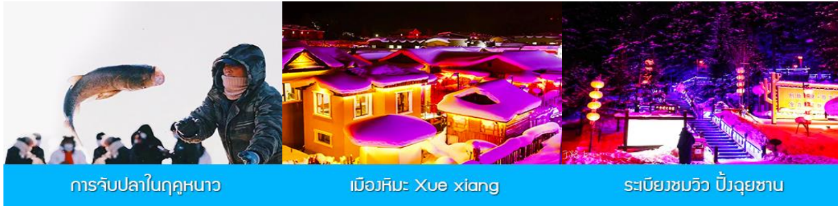
การจับปลาในฤดูหนาว