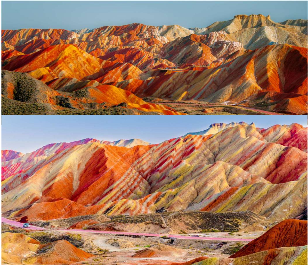
T2G-CAN01CZ เส้นทางสายใหม่...หลานโจว จางเย่ ตุนหวง ภูหลู่ฟาน ภูหลู่ฉี 8D 7N

จากนั้นนำท่านเดินทางชม อุทยานธรณีแห่งชาติจางเย่ (Zhangye) ชมความมหัศจรรย์แห่งสีสันของ ภูเขาสายรุ้ง มรดกโลกแดนมังกร เกิดจากปรากฏการณ์ทางธรรมชาติของภูมิลักษณะดินเสีย ในอุทยานธรณีโลกจางเย่ แห่งเมืองจางเย่ มณฑลกานซูทางตะวันตกเฉียงเหนือของจีน ที่ทำให้บรรดานักท่องเที่ยวที่มาเยี่ยมเยือนรู้สึกทึ่งกับหลุดเข้าไปอยู่ในภาพวาด ดงงามตื่นตาและได้รับการยกย่องว่าเป็น "ภูเขาสายรุ้งแห่งแดนเหนือ" หนึ่งในธรรมชาติที่งดงามที่สุดแห่งจีนแผ่นดินใหญ่ (รวมมรดกอุทยาน)