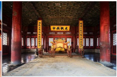
พระราชวังกู้กง