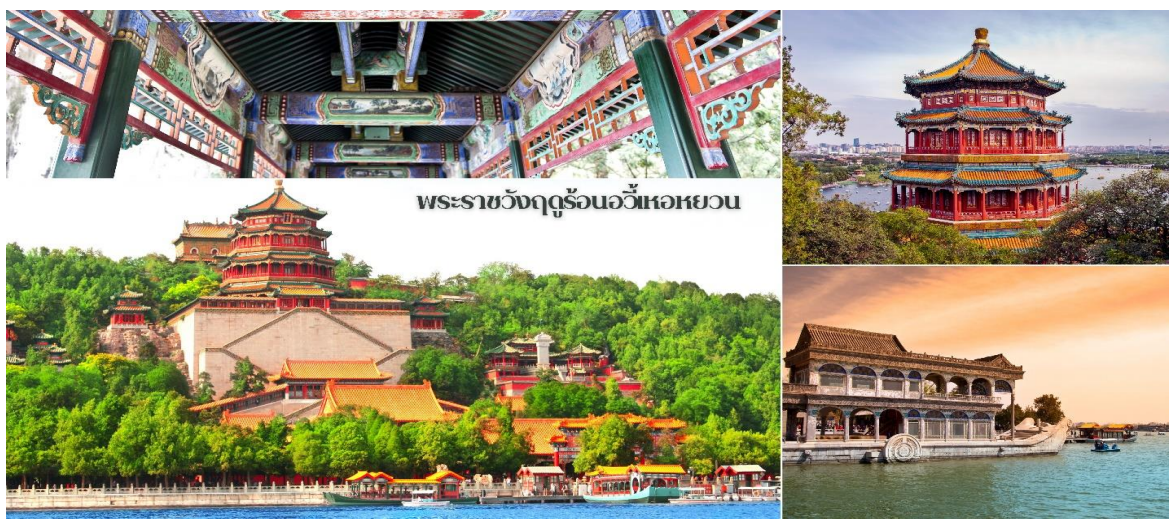
พระราชวังฤดูร้อนอวิ๋เหอหยวน