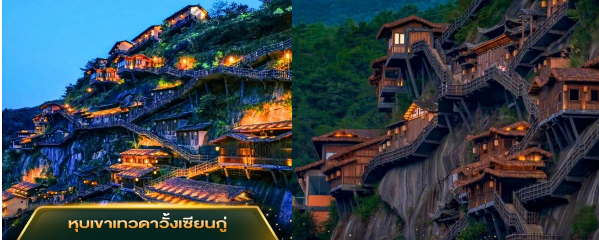
หมู่บ้านเกวคาวิ้งเซียนกุ

ตอนกลางคืนจะเปิดไฟแบบจัดเต็มแล้ว ยังมีมุมสะพานโค้งๆ ที่เป็นอีกหนึ่งแลนด์มาร์คที่คนนิยมไปถ่ายรูปลงโซเชียลกัน หรือถ้าใครชอบธรรมชาติ จะถ่ายภาพกับวิวทิวเขา น้ำตก หน้าผา ก็สวยไปอีกแบบ วิวอลังการเหมือนอยู่ในหนังจีน