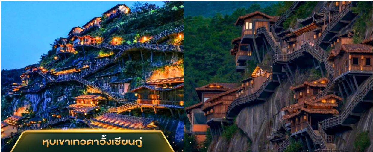
หมู่บ้านหวงเฉิงชานกุ๋

ผสมผสานกับธรรมชาติเข้าไว้ด้วยกันได้อย่างลงตัว ปัจจุบันมีสิ่งอำนวยความสะดวกมากขึ้น ทั้ง ถนนหนทาง ที่พักอาศัย ร้านค้า ร้านอาหาร รวมทั้งผับบาร์ต่าง ๆ ทำให้ปัจจุบันได้มีการปรับสถานะเป็นสถานที่ท่องเที่ยว 4A ในระดับมณฑลของมณฑลเจียงซี ที่นี้สามารถมาเที่ยวได้ตลอดทั้งปี ที่นี้มีมุมถ่ายรูปสวย ๆ ให้ได้ถ่ายภาพเยอะมาก นอกจากมุมหมู่บ้านห้อยที่เรียงรายบนผาอย่างสวยงาม ตอนกลางคืนจะเปิดไฟแบบจัดเต็มแล้ว ยังมีมุมสะพานโค้ง ๆ ที่เป็นอีกหนึ่งแลนด์มาร์คที่คนนิยมไปถ่ายรูปลงโซเชียลกัน หรือถ้าใครชอบธรรมชาติ จะถ่ายภาพกับวิวทิวเขาน้ำตก หน้าผา ก็สวยไปอีกแบบ วิวอลังการเหมือนอยู่ในหนังจีน