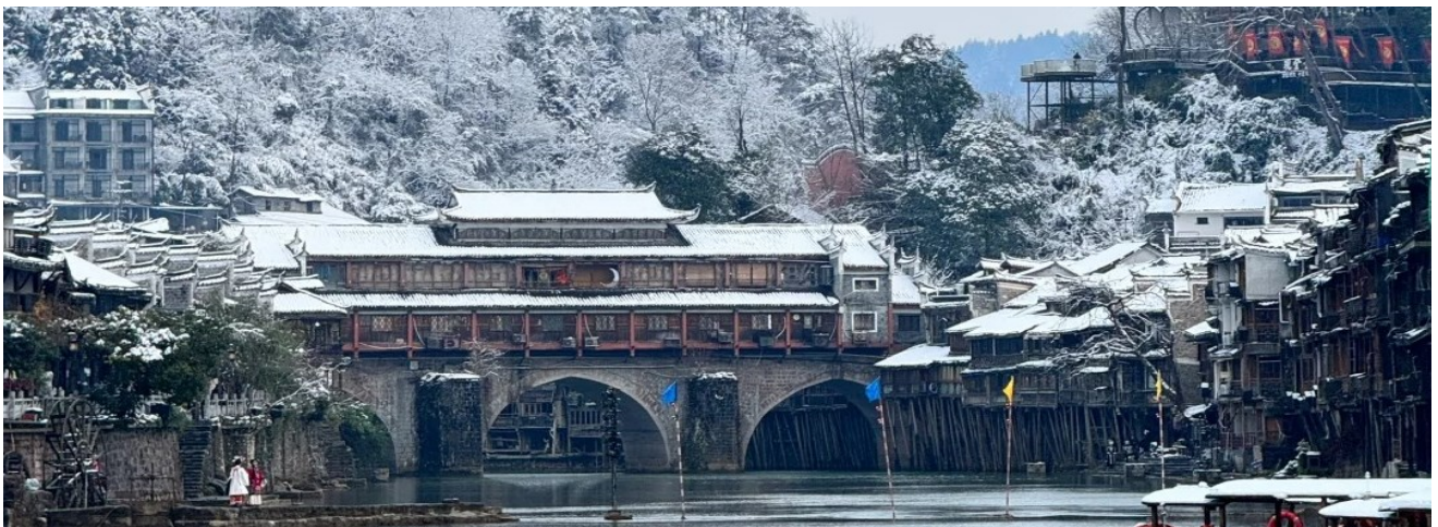
บ่าย นำท่านเดินทางสู่ เมืองเฟิ่งหวง (ระยะทาง 85 ก.ม. ใช้เวลาเดินทางประมาณ 2 ชั่วโมง) หรือ เมืองโบราณเฟิ่งหวง(เมืองหงส์) เป็นเมืองที่ขึ้น อยู่กับเขตปกครองตนเองของชนเผ่าน้อยอุเจีย ตั้งอยู่ ทางทิศตะวันตกของมณฑลหูหนาน เมืองโบราณหงส์ตั้งอยู่ริมแม่น้ำถั่ว ล้อมรอบด้วยขุนเขาเหมือนด่าน ช่องแคบภูเขา ที่