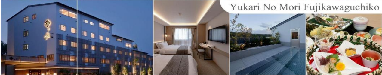
Yukari No Mori Fujikawaguchiko