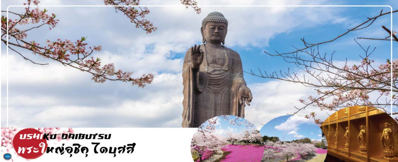
USHIKU DAIBUTSU พระใหญ่อุซึกุ ไดบุตสึ

นำท่านนมัสการ พระใหญ่อุซึกุ ไดบุตสึ (Ushiku Daibutsu) (ใช้เวลาเดินทางประมาณ 50 นาที) เป็นพระพุทธรูปปางยืนที่สูงที่สุดของประเทศญี่ปุ่น และเคยเป็นรูปปั้นที่สูงที่สุดในโลกที่ถูกบันทึกไว้โดยหนังสือบันทึกสถิติโลกกินเนสบุ๊ค (Guinness Book of world records) เมื่อปี ค.ศ. 1995 ด้วยความสูงถึง 120 เมตร ทำให้สามารถมองเห็นได้ตั้งแต่ใจกลางเมืองโดเกียวเลยทีเดียว สามารถเข้าไปยังบริเวณภายในรูปปั้นและขึ้นไปยังจุดที่เป็นหอสังเกตการณ์ในระดับความสูงที่ 85 เมตร ซึ่งจะอยู่ตรงส่วนของหน้าอกพระพุทธรูป เป็นจุดที่สามารถมองเห็น วิวในมุมด้านกว้างได้ ทั้งหมด บนชั้นนี้จะมีกระจกที่เป็นช่องหน้าต่างอยู่ด้วยกัน 4 ด้าน และมองเห็นภูเขาไฟฟูจิได้จากตรงนี้อีกด้วย ( ราคาไม่รวมค่าเข้าพระพุทธรูปด้านใน ) บริเวณใกล้เคียงจะมีสวนขนาดใหญ่เนื่องจากต้นไม้ในสวนส่วนมากเป็นต้นซากุระ ในช่วงที่ซากุระบานที่นี่จึงสวยงามเป็นพิเศษ เรียกได้ว่ามาไหว้พระอย่างเดียวก้ออึมบุญแล้ว แล้วยังได้อึ้งใจไปกับวิวสวยๆอีกด้วย ( จุดชมซากุระขึ้นกับภูมิอากาศ ) ( ราคาไม่รวมค่าเข้าชมสวน ) นำท่านเดินทางสู่ เมืองนาริตะ (ใช้เวลาเดินทางประมาณ 40 นาที)