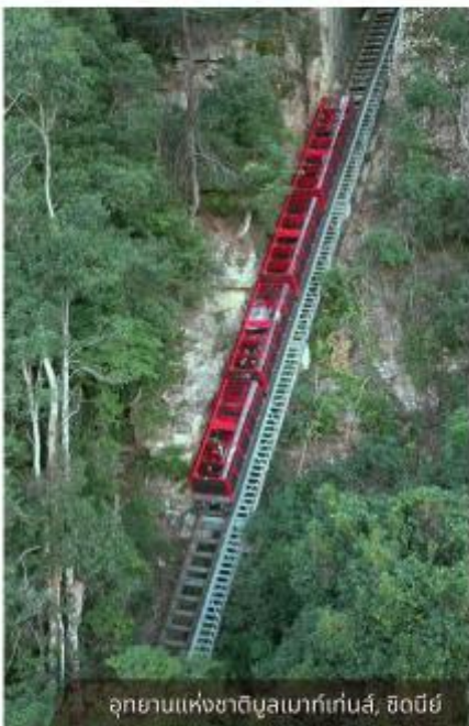
อุทยานแห่งชาติบลูเมาท์เทนส์, ซิดนีย์