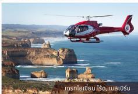
เกรทโอเชียน ไรด์, เมลเบิร์น