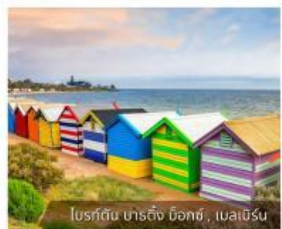
โบสถ์สีรุ้ง บาร์คิง น็อกซ์, เมลเบิร์น