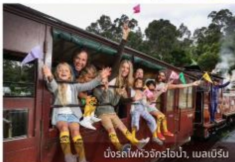
มิ่งรถไฟหิวจักรไอน้ำ, เมลเบิร์น