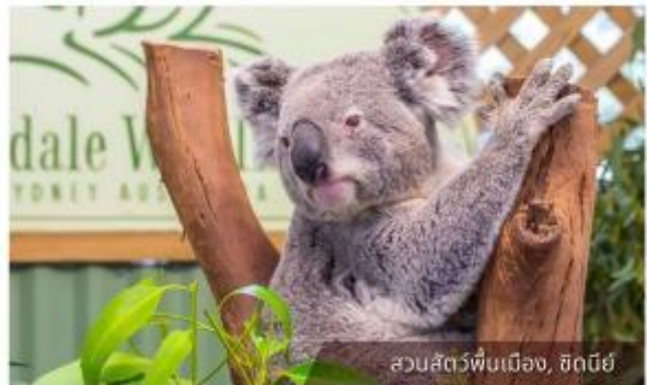
สวนสัตว์พื้นเมือง, ซิดนีย์