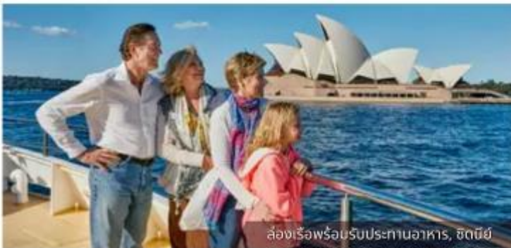
ล่องเรือพร้อมรับประทานอาหาร, ซิดนีย์