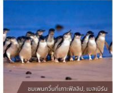
ชมเพนกวินที่เกาะฟาลิป, เมลเบิร์น