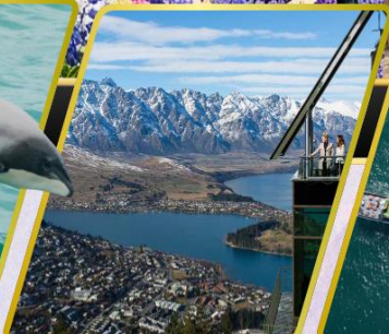
ยอดเขานีออนส์พีค