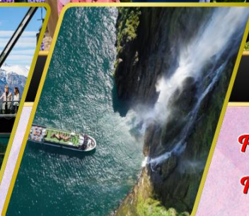
ล่องเรือมิลฟอร์ด ซาวน์