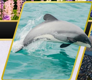
ล่องเรือชมปลาโลมา