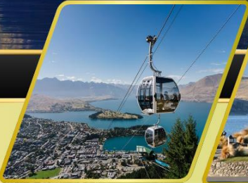
นั่งกระเช้าคอนโดล่า