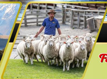
วอลเตอร์ฟิคฟาร์ม