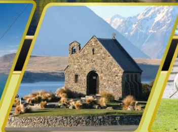
ทะเลสาบเทคาโป