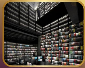
ชมร้านหนังสือ PAGE ONE