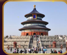
ชมความงดงาม หอฟ้าเทียนถาน