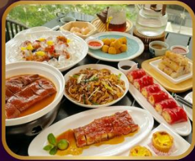
อาหารระดับ มิชลิน TAO TAO JU