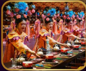
กิตติาคารวังหลวง YU XIAN DU