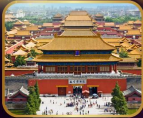
เขื่อนมรดกโลก พระราชวังกู้กง