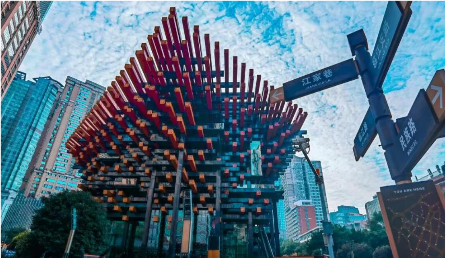
ชองฮงตงตง

ภายในเป็นศูนย์รวมศิลปะสมัยใหม่ ที่มีโรงละคร ห้องจัดนิทรรศการ และแกลเลอรี จัดกิจกรรมศิลปะที่หลากหลายตลอดทั้งปี ดึงตะเกียบจึงไม่ได้เป็นแค่อาคาร แต่เป็นสัญลักษณ์ทางสถาปัตยกรรมที่ผสมผสานความดั้งเดิมเข้ากับความทันสมัยได้อย่างลงตัว สะท้อนถึงเอกลักษณ์ของเมืองฉงชิ่งได้เป็นอย่างดี