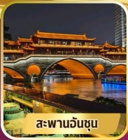
สะพานอันชุน