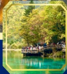
อุทยานแห่งชาติ จิวจ้ายโกว