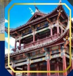
เมืองโบราณ ซงพาน