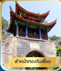
ตึกนักทองจีนเตียน