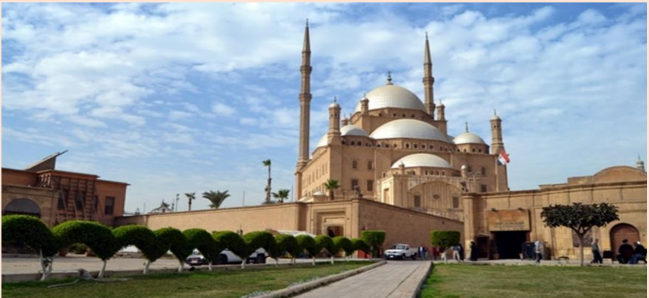
6 (ภาพใช้เพื่อการโฆษณาเท่านั้น)

นำทุกท่านขึ้นชม ป้อมปราการ (Citadel) ซึ่งถูกสร้างขึ้นโดย ผู้นำชาลาตินในปี ค.ศ.1176และเสร็จในปี ค.ศ. 1182 เพื่อใช้ในการต่อสู้ในสงครามครูเสด ซึ่งภายในสามารถชมที่พักและที่ตั้งของรัฐบาลในสมัยนั้น ชม สุเหร่าแห่งโมฮัมเหม็ดอาลี ซึ่งเริ่มสร้างในปี ค.ศ. 1830 และเสร็จในปี ค.ศ.1857 ออกแบบโดยสถาปนิกชาวกรีกตามแบบอย่างออตโตมันหรือตุรกีในปัจจุบัน ภายในมีนาฬิกาบนลานในสุเหร่าซึ่งเป็นของขวัญในการแลกเปลี่ยนกับอนุสาวรีย์ปลายแหลมโอปิลิสก์ของรามเสสที่ 2 เพื่อเป็นการสร้างสัมพันธไมตรีอันดีระหว่างอียิปต์และฝรั่งเศส