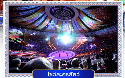
โชว์ละครสัตว์