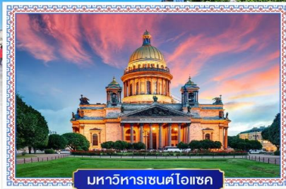
มหาวิหารเซนต์ไอแซค