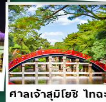
ศาลเจ้าสุมิโยชิ ไทละ