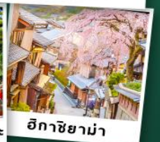
อึกาชิยาม่า