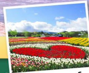
สวนบกคะโนะ ซาโตะ