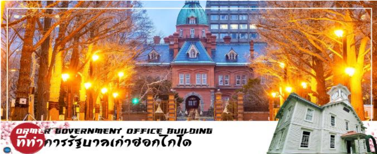
FORMER GOVERNMENT OFFICE BUILDING ที่ทำการรัฐบาลเก่าซอกไกโด

จากนั้นนำท่านเดินทางสู่ เมืองซัปโปโร (SAPPORO) (ใช้เวลาเดินทางประมาณ 1.20 ชั่วโมง)