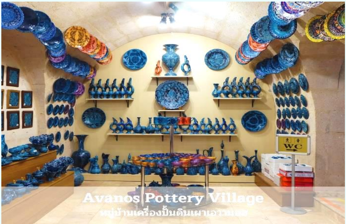
Avanos Pottery Village หมู่บ้านเครื่องปั้นดินเผาอวานอส

จากนั้นนำท่านแวะชม หมู่บ้านเครื่องปั้นดินเผาอวานอส (AVANOS) หมู่บ้านที่มีชื่อเสียงเกี่ยวกับเครื่องปั้นดินเผา อุปกรณ์ที่ใช้ภายในบ้าน ถ้วย,ชาม,ไห,โอ่ง,แจกันและเครื่องประดับบ้าน