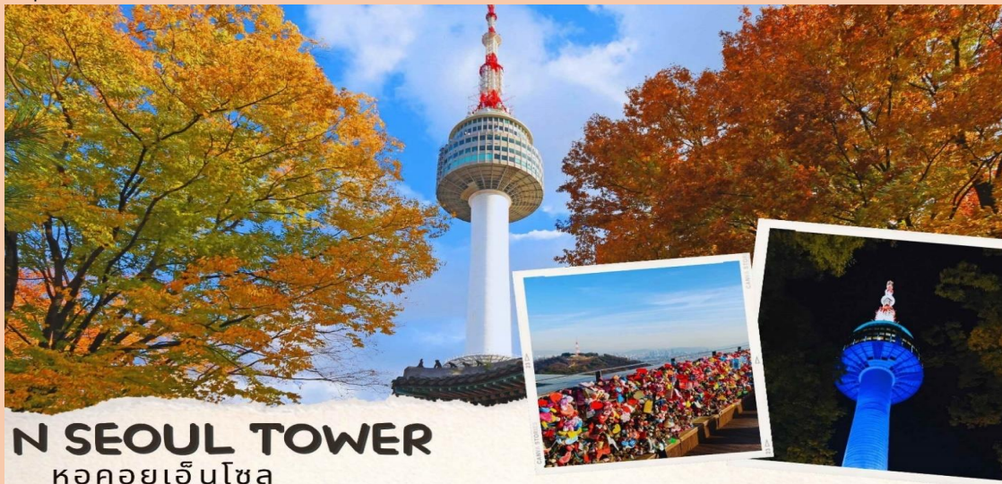
N SEOUL TOWER หอคอยเอ็นโซล

หลังจากนั้น นำท่านไปช้อปปิ้งที่ ศูนย์รวมเครื่องสำอางแบรนด์ดังเกาหลี (COSMETIC SHOP) เช่น WATER DROP (ครีมหน้าแตก) , SNAIL CREAM (ครีมเมือกหอยทาก) , BOTOX (โบท็อกซ์) , ALOE VERA PRODUCT (ผลิตภัณฑ์จากสมุนไพร ว่านหางจระเข้) เป็นต้นหลังทานอาหารเย็น จากนั้นนำท่านสู่ หอคอยกรุงโซล N Tower (ไม่รวมค่าลิฟต์) ซึ่งอยู่บริเวณเนินเขานัมซานซึ่งเป็น 1 ใน 18 หอคอยที่สูงที่สุดในโลกที่ฐานของหอคอยมีสิ่งที่น่าสนใจต่างๆ เช่น ศาลาแปดเหลี่ยมพลาทีกักจอง, สวนสัตว์เล็กๆ, สวนพฤกษชาติ, อาคารอนุสรณ์ผู้รักชาติอันซุงกุน อีสระให้ทุกท่านได้เดินเล่นและถ่ายรูปคู่หอคอยตามอัธยาศัยหรือคล้องกัญแจคูร์ัก