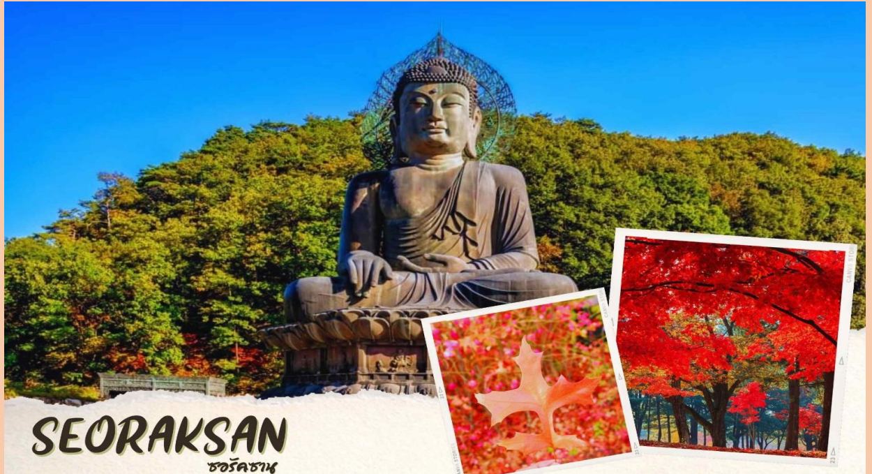
SEORAKSAN ซอรัคซาน

ซึ่งเกิดขึ้นเองตามธรรมชาติที่หาดูธรรมชาติที่หาดูได้ยากยิ่ง ตามรอยตำนานที่เล่าขานของจุดกำเนิดเพลงอารีรัง ภูเขาซอรัคซานมีความงามเฉพาะตัวตลอดปีอยู่แล้ว แต่ช่วงฤดูใบไม้เปลี่ยนสีจะเป็นช่วงที่งดงามที่สุด นักท่องเที่ยวจะชอบเดินทางกันในช่วงนี้ เพื่อชมความงามของใบไม้สีต่างๆ ประมาณเดือนตุลาคม ทั่วทั้งบริเวณ ใบไม้จะกลายเป็นสีแดงและสีเหลือง