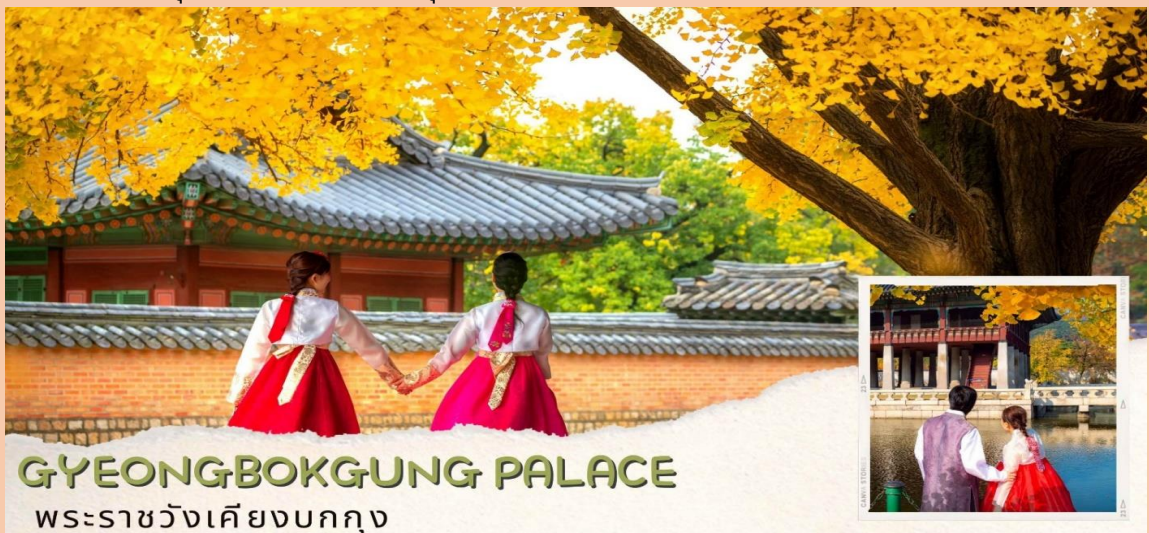
GYEONGBOKGUNG PALACE พระราชวังเคียงบกกุง

นำท่านเดินทางสู่ ศูนย์โสภณรัฐบาล ซึ่งรัฐบาลรับรองคุณภาพว่าผลิตจากโสมที่มีอายุ 6 ปีซึ่งถือว่าเป็นโสมที่มีคุณภาพดีที่สุดชมวงจรชีวิตของโสมพร้อมให้ท่านได้เลือกซื้อโสมที่มีคุณภาพดีที่สุดและราคาถูกกว่าไทยถึง 2 เท่ากลับไปบำรุงร่างกายหรือฝากญาติผู้ใหญ่ที่ท่านรักและหนีบถืออีกไม่ไกลจากกันมากนัก จากนั้นนำท่านเรียนรู้วิธีการทำ คิมบับ(ข้าวห่อสาหร่าย) อาหารง่าย ๆ ที่คนเกาหลีนิยมรับประทานโดยการนำข้าวสุกและส่วนผสมอื่นๆหลากหลายชนิด เช่น แดงกวา แครอท ผักโขม ไข่เจียว ปูอัด แฮม เป็นต้น แล้วแต่วัตถุดิบที่ท่านสะดวกวางแผ่นบนแผ่นสาหร่ายแล้วม้วนเป็นแท่งยาวๆ จากนั้นหั่นเป็นชิ้นพอดีคำ ชาวเกาหลีนิยมรับประทานคิมบับระหว่างการปิกนิก หรืองานกิจกรรมกลางแจ้ง หรือรับประทานเป็นอาหารกลางวันเบาๆ โดยเสิร์ฟกับหัวไชเท้าดองและกิมจิ นอกจากนี้คิมบับยังเป็นอาหารนำกลับบ้านที่เป็นที่นิยมทั้งในเกาหลีและต่างประเทศ จากนั้นพาท่านไป ศูนย์สมุนไพรสนเข็มแดง (RED PINE) เป็นผลิตภัณฑ์ ที่สกัดจากน้ำมันสน มีสรรพคุณช่วยบำรุงร่างกายลดไขมัน ช่วยควบคุมอาหารและรักษาสมดุลในร่างกายได้เป็นอย่างดี